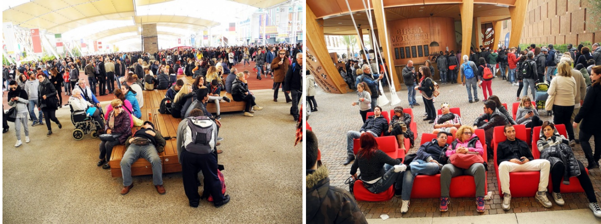
Dall'alto: Pieter Bruegel il Vecchio, Il Paese della Cuccagna (1567); Milano, Expo 2015, 25 ottobre

Ma c'è stato probabilmente un altro esito interessante di questa monumentale esposizione dedicata al cibo, che l'ha differenziata da tutte quelle che l'hanno storicamente preceduta. Se in queste ultime il desiderio di universalismo si trasformava surrettiziamente in bieca predominanza del modello capitalistico occidentale, economico come estetico, qui il livellamento etnocentrico ha dovuto fare fiasco. Al di là degli stereotipi turistici d'ogni singolo paese, orribilmente mimati nelle soluzioni architettoniche dei loro padiglioni, dei souvenir kitsch d'ordinanza, dei tristi cappellini asiatici e dei grembiuloni post-contadini dell'Est Europa, delle danze folkloriche da dopolavoro automobilistico accompagnati dalle musiche distorte di improbabili altoparlanti vintage, la facevano da padrone, a conti fatti, i sapori e i sentori irriducibilmente diversi delle realtà locali. La globalizzazione, qui, non ha potuto funzionare in tutto e per tutto: alla biodiversità glorificata dalla collina finale di Slow Food si accompagnava per ogni angolo della fiera una gloriosa, irrinunciabile etnodiversità. Il trionfo del glocal , insomma, in nome di una gastronomia pop, caricaturale talvolta, patetica talaltra, ma comunque vincente. Expo 2015, almeno in questo, è stato un successo.