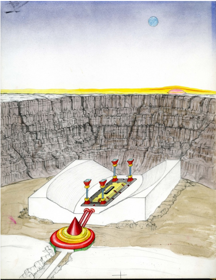
Ettore Sottsass, Pianeta come Festival

In realtà, per poterlo ancora usare mantenendosi al riparo da possibili equivoci o da impossibili approssimazioni, il termine "comunità" deve essere sottoposto a un'indispensabile revisione. Per Olivetti la comunità è stata la pietra angolare sulla quale ha basato molteplici imprese, tra il 1945 e il 1960: una rivista, una casa editrice e sopra ogni altra cosa un movimento politico, animato da una "federazione laica" in un'Italia federalista, solidarista e personalista. Accostando e mescolando ideologie fra di loro molto diverse, Olivetti ha postulato la possibile esistenza di una «società socialista-comunista e cristiana», come scrive in L'ordine politico delle Comunità , la trattazione organica del suo pensiero in materia di organizzazione statale pubblicata all'indomani della cessazione delle ostilità: «La Comunità è intesa a sopprimere gli evidenti contrasti e conflitti che nell'attuale organizzazione economica normalmente sorgono e si sviluppano fra l'agricoltura, le industrie e l'artigianato ove gli uomini sono costretti a condurre una vita economica e sociale frazionata e priva di elementi di solidarietà». «Creando un superiore interesse concreto», afferma Olivetti, la Comunità tende a «comporre detti conflitti e ad affratellare gli uomini».