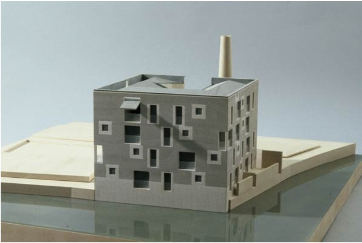
Cino Zucchi, Giudecca (Venezia)