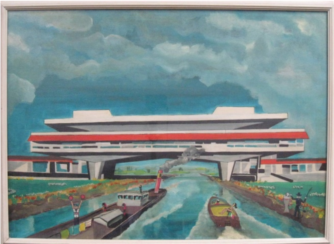
Angelo Bianchetti, L'autostrada è un fiume , 1973

E tuttavia, non soltanto nell'Italia del dopoguerra, fortemente divisa tra schieramenti politici fieramente contrapposti, e poi nell'Italia della crisi seguita al boom economico, scossa da tensioni via via sempre crescenti, l'idea di una comunità pacificata e animata da principi di fratellanza appare del tutto irreali, oltreché irrealizzabile; ma anche nella riflessione filosofica più generale elaborata nel corso degli ultimi cinquant'anni, incentrata sul tentativo di definire il senso della comunità, quest'ultima è sempre considerata un problema, assai più di quanto non riesca a rappresentare una soluzione. La comunità, in questo senso, risulta una proiezione mitica, un'ideale da inseguire più che un obiettivo concretamente raggiungibile. E ancor di più: la comunità non è un progetto che si possa perseguire positivamente, né qualcosa che unisca semplicemente sulla base di una decisione o di un'adesione: non è qualcosa che tutti i suoi componenti possedano, e che dunque conferisca un'identità a ciascuno e ancor meno, che conferisca un'identità a tutti. Non vi è alcuna omogeneità, alcuna comunanza d'intenti o di idee in essa, o grazie a essa. Piuttosto la comunità è qualcosa che condiziona tutti coloro che vi appartengono, qualcosa che tutti subiscono e con cui tutti sono costretti a confrontarsi, ciascuno a modo proprio, e dunque in modi anche nettamente differenti.