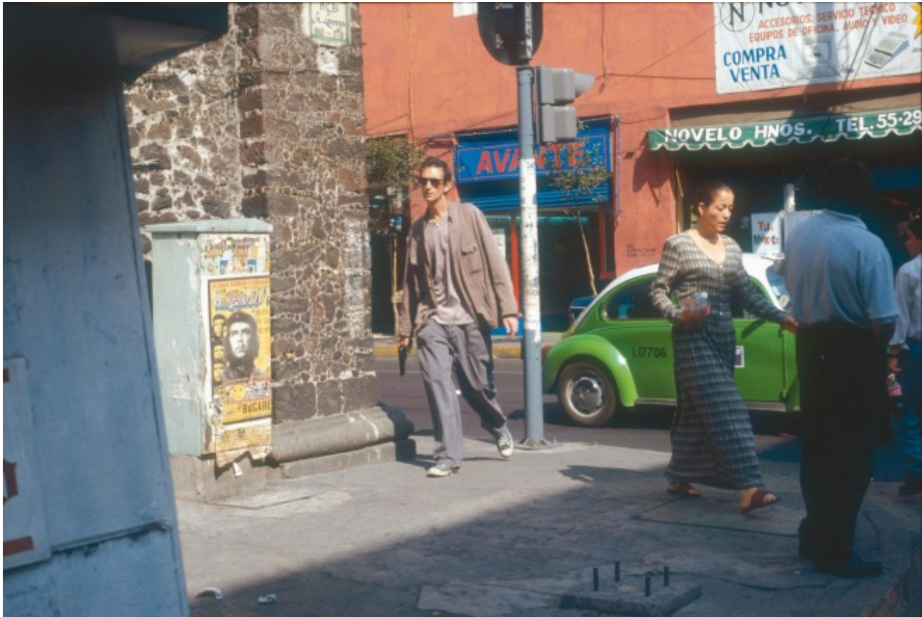
Francis Alys, Reenactment, 2000

strade di Città del Messico in pieno giorno prima di essere fermato, undici minuti dopo, dalla polizia. Ripenso a quella nuvola che avanza per le strade deserte di Parigi e copre le macchine parcheggiate quanto le insegne dei negozi in Projection (2005) di Laurent Grasso. Ripenso persino a Air de Paris (1919) di Marcel Duchamp che, dietro l'apparente neutralità dell'ampolla farmaceutica, evoca la diffusione delle maschere a gas durante la Prima guerra mondiale.