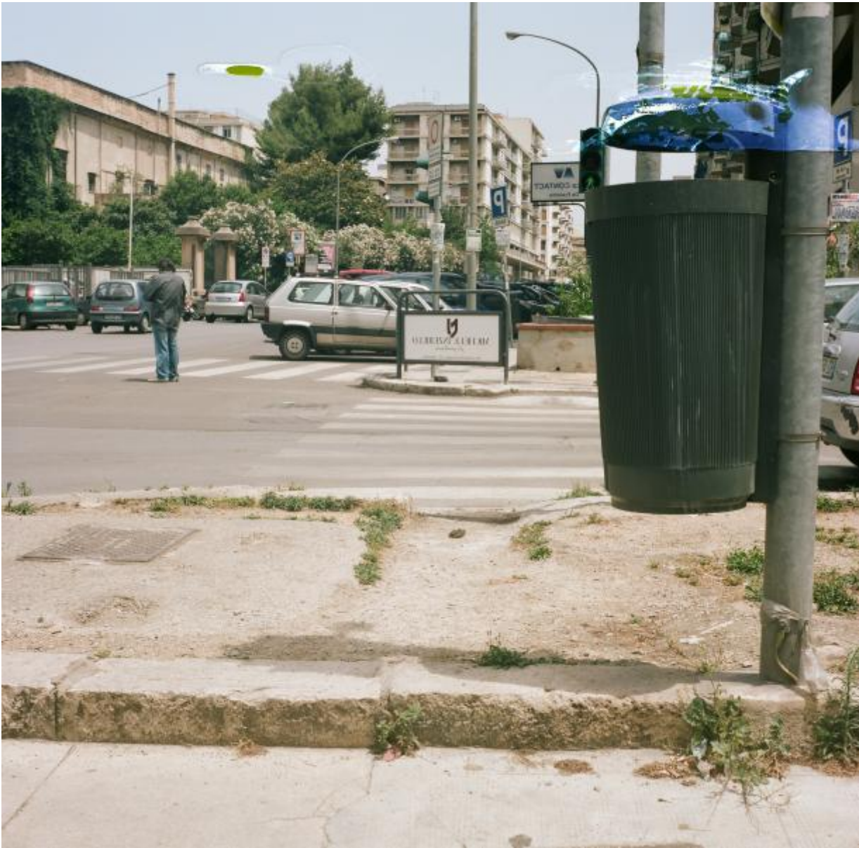
Sentiero De Gasperi