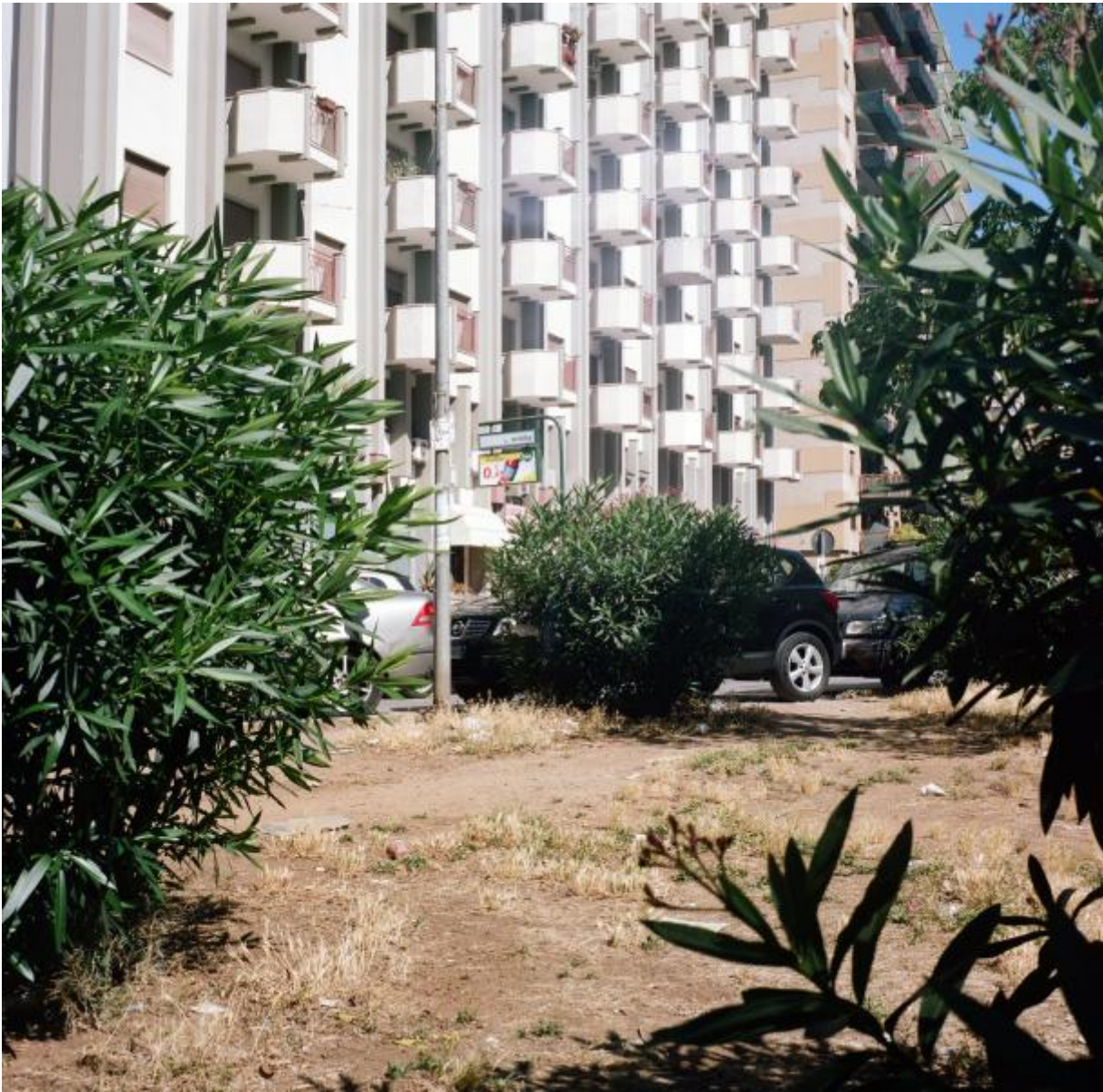
Sentiero Croce Rossa

Similmente fanno i pedoni col loro cammino, per raggiungere nel modo piÃ¹ lineare e veloce un punto d'interesse comune, come la fermata del bus, oppure per tagliare velocemente due strade parallele o che fanno angolo, laddove le strisce pedonali porterebbero di fronte ad un ostacolo o allungherebbero il tragitto.