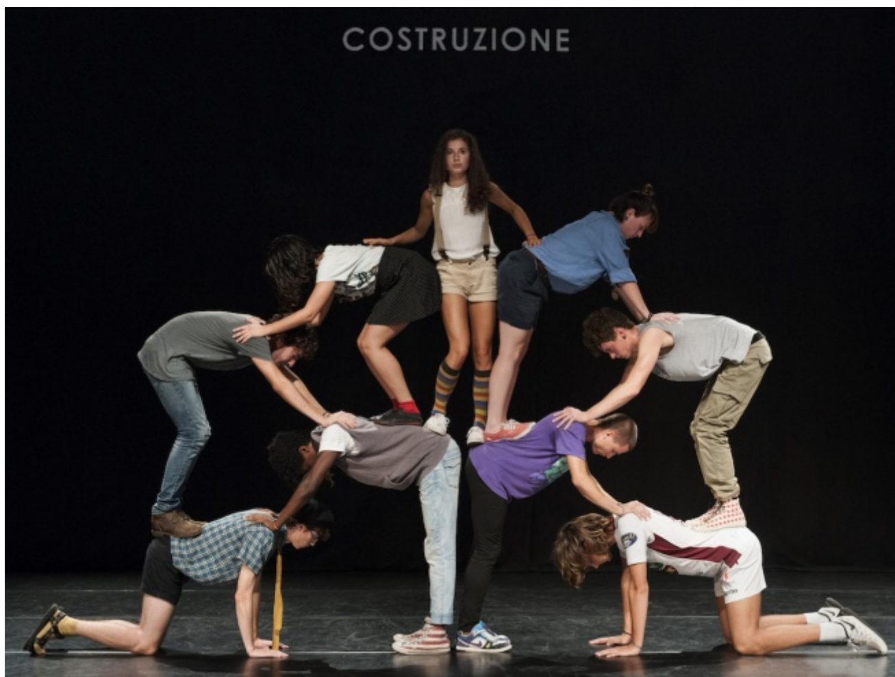
CollettivO CINETICO, Age

In attesa di lanciarsi nell'impresa futura della produzione di un vero e proprio classico del balletto, prima di una personale che in primavera Emilia Romagna Teatro dovrebbe dedicargli a Bologna, CollettivO CINETICO ha replicato due lavori recenti nel teatro Claudio Abbado della sua città, Ferrara. Ed è stato un gran successo, salutato da una notevole partecipazione di pubblico giovane, entusiasta, solidale, curioso, una testimonianza dell'affetto per questa compagnia che lavora in residenza proprio presso quel teatro comunale, dove ha svolto anche un laboratorio per universitari basato sugli sguardi.