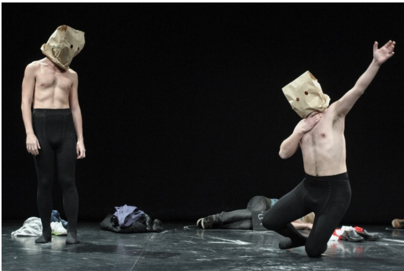
CollettivO CINETICO, Amleto