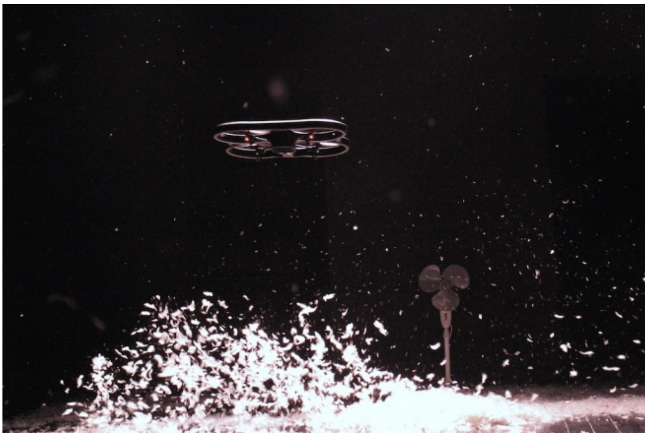
CollettivO CineticO, Miniballetti

I Miniballetti , e qui entra un altro elemento della scomposizione-ricomposizione su un altro piano del cubismo CineticO, erano brevi coreografie annotate su un quadernetto dalla Pennini bambina e pre-adolescente, a testimoniare una vocazione precoce coltivata poi con puntigliosa, disciplinata, bruciante passione. Ora la danzatrice realizza quei sogni di bambina: e sembra che abbia studiato, tutti questi anni, danza, ginnastica, solo per materializzare fantasie, desideri infantili.