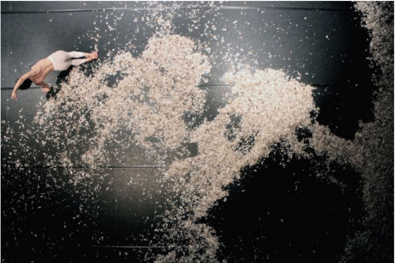
CollettivO CineticO, Miniballetti

Danza piena di ironia, di tecnica puntigliosa e raffinatissima, di sfide immaginative, quando il corpo si lancia e allora dei numeri elencati rimane solo un vortice mentale, la meraviglia per la quantità che fa il salto imprevisto nella qualità, dimostrando che l'arte vive di salti, di precipizi, di accelerazioni impreviste, improvvise, tese sempre in equilibrio immaginale sull'abisso.