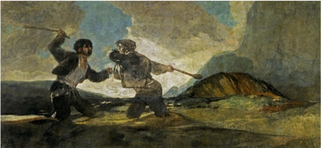
Francisco Goya, Duello Rusticano , 1823