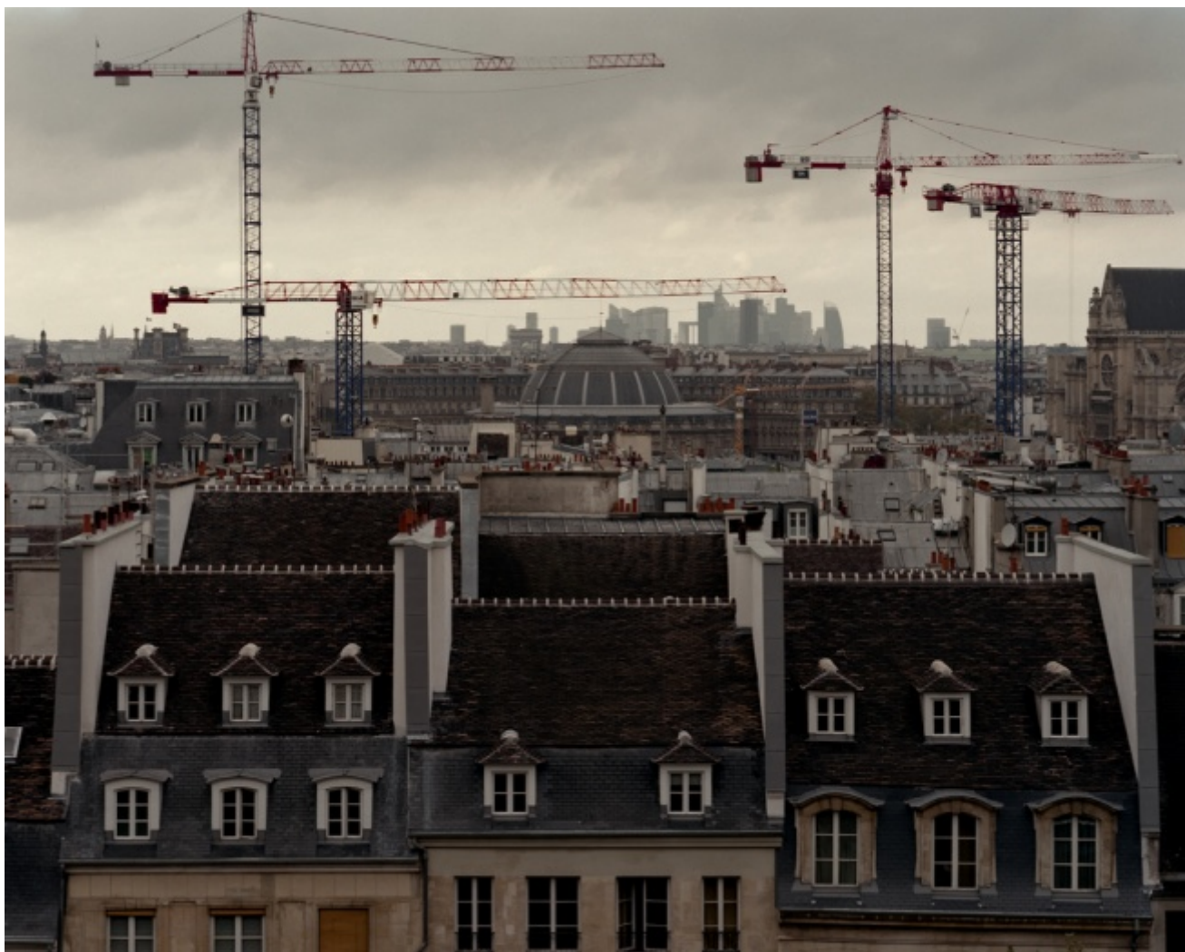
Beaubourg view, 2012

Se c'è un tratto comune che affiora dall'accostamento di queste due storie - al di là del fatto che i carnefici, nel momento in cui si trovano a scambiarsi di ruolo con le vittime, sembrano reagire alla loro stessa maniera - è l'ostentazione della propria umana fragilità al cospetto del mortifero dilagare della guerra. Al netto di tutta l'enfasi del presente sulla debolezza dei nostri valori, forse la via per uscire da questa notte in cui i tamburi suonano sempre più forte si può trovare soltanto rovesciando i termini della questione e rivendicando in maniera netta il paradosso per il quale è la debolezza stessa a dover essere considerata un valore e che, indipendentemente dal lato della barricata dietro il quale ci si trovi schierati, esso va difeso a tutti i costi. Risalendo lungo il filo dei ricordi mi ritrovo a fissare un piccolo promemoria per l'avvenire: quando sarò a Parigi, recarmi al Père-Lachaise e cercare la tomba dove riposa Mathilde Arditti, vedova Canetti. La ragione di questo appunto in mezzo al fiume dei pensieri non nasce tanto dalla volontà di rendere omaggio a una inveterata pacifista, quanto dalla necessità di ricordare che "è bene che si affermi il diritto del più debole. Quelli che noi non riusciamo a proteggere devono poter rinfacciarci che non abbiamo fatto niente per la loro salvezza. Nel loro rimprovero è racchiusa la sfida che tramandano a noi, la divina illusione che potremmo riuscire a vincere la morte".