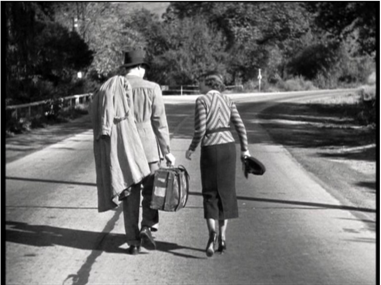
Accadde una notte (It Happened one Night), di Frank Capra, 1934