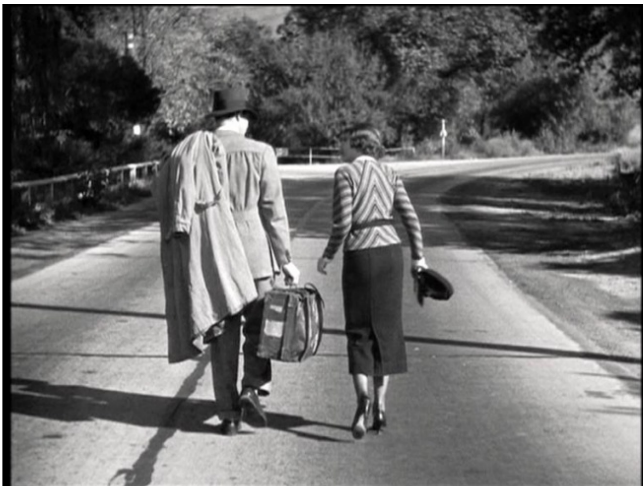
Accadde una notte (It Happened one Night), di Frank Capra, 1934