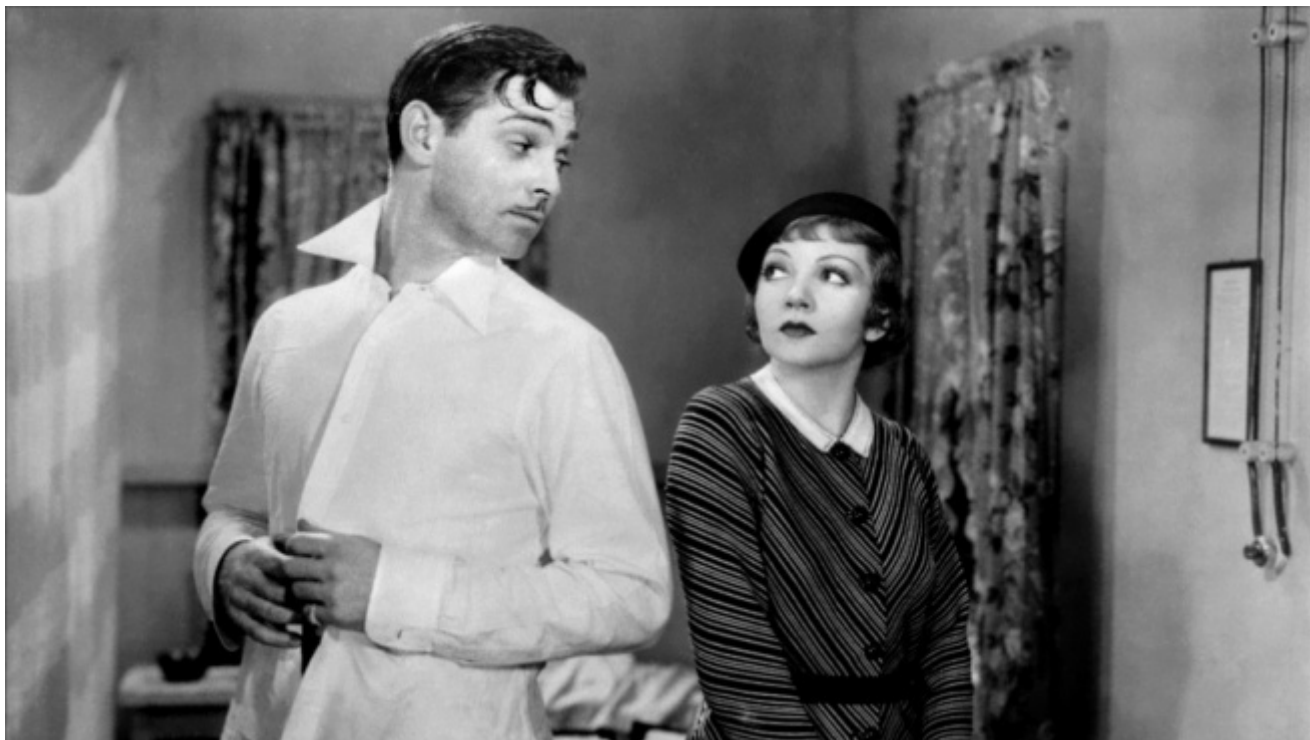
Accadde una notte (It Happened one Night), di Frank Capra, 1934