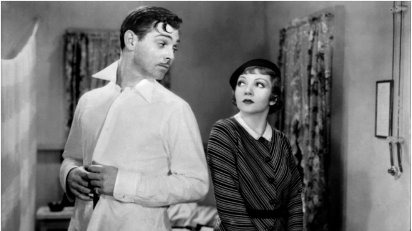
Accadde una notte (It Happened one Night), di Frank Capra, 1934