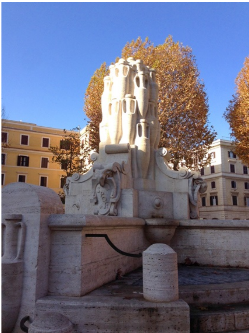
Fontana delle Anfore