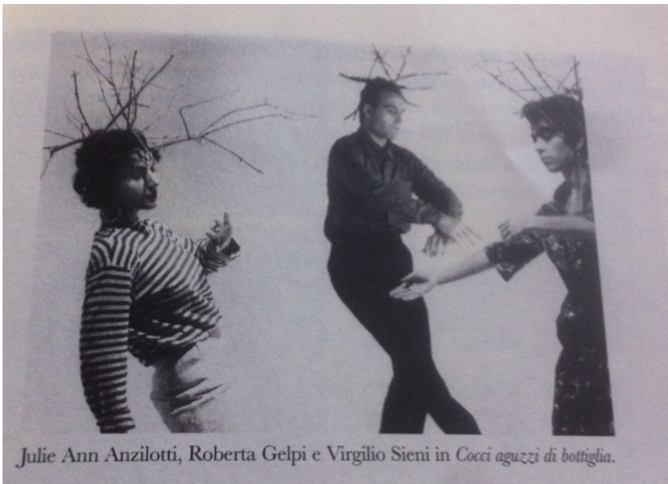
Parco Butterfly, 1985