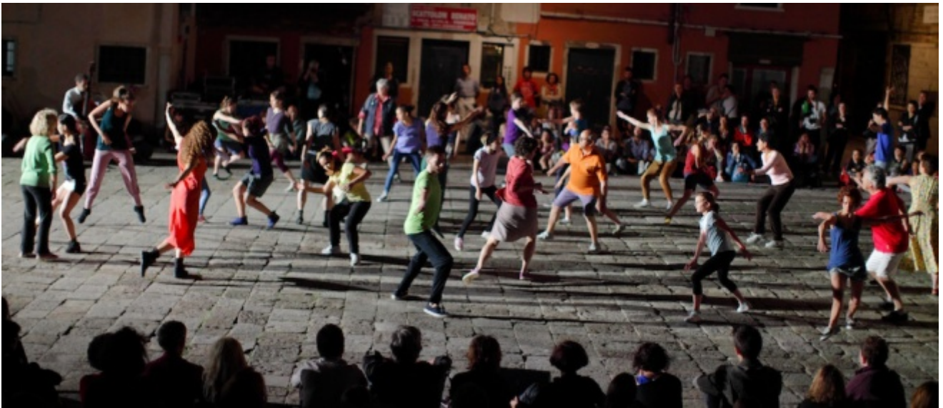
Agorà, Biennale Danza 2013