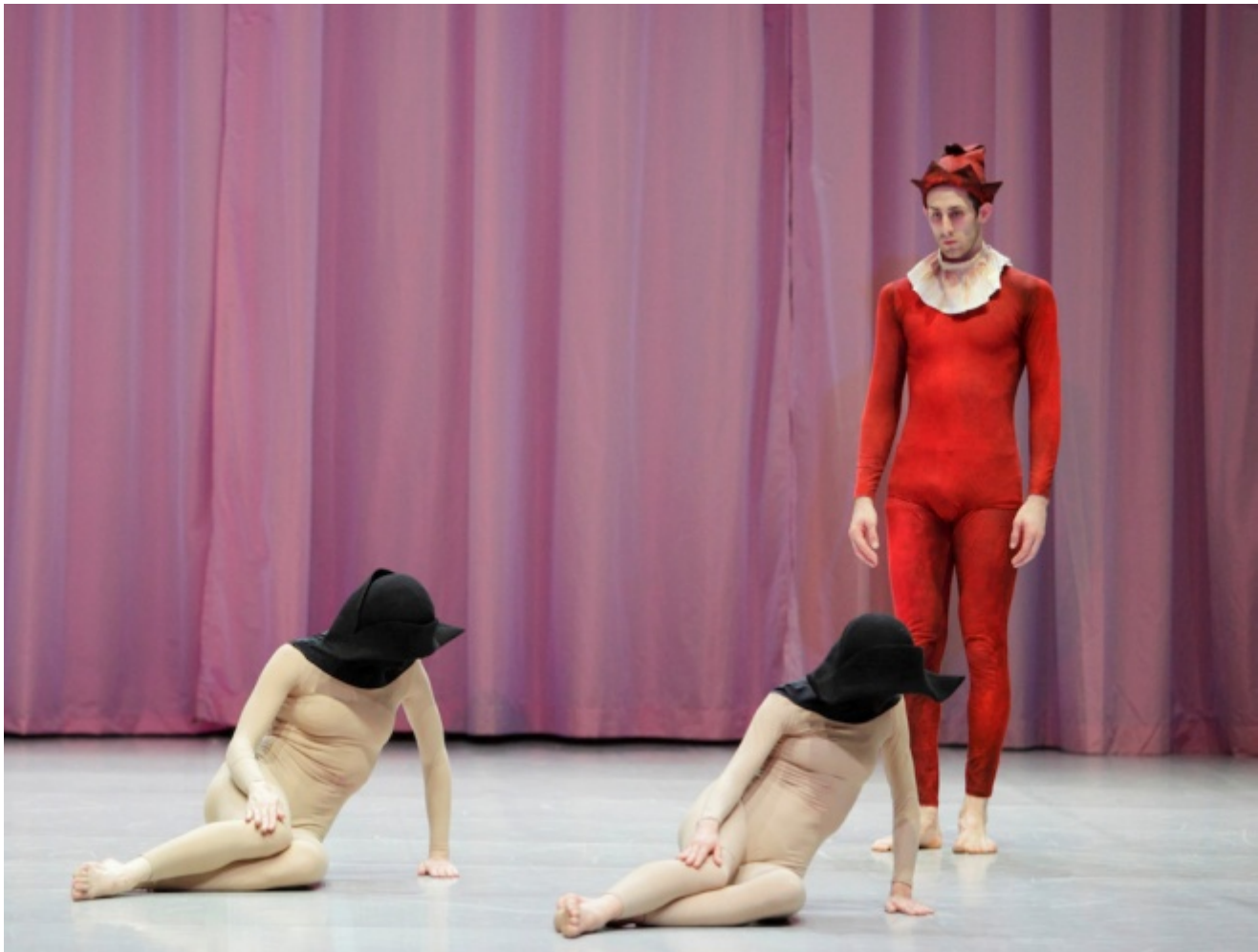
De Anima, 2012

Se si osserva la teatrografia pubblicata alla fine del volume, si notano dal 1990 sempre moltissimi titoli per anno (e se si allineassero le realizzazioni del 2015 appena trascorso lo sguardo si farebbe addirittura vertiginoso). Nel senso che spesso lo spettacolo completo, finito, da palcoscenico Ã¨ preceduto, accompagnato, dilatato con installazioni, dispositivi preparatori o derivati, esplorazioni, studi e ogni altro tipo