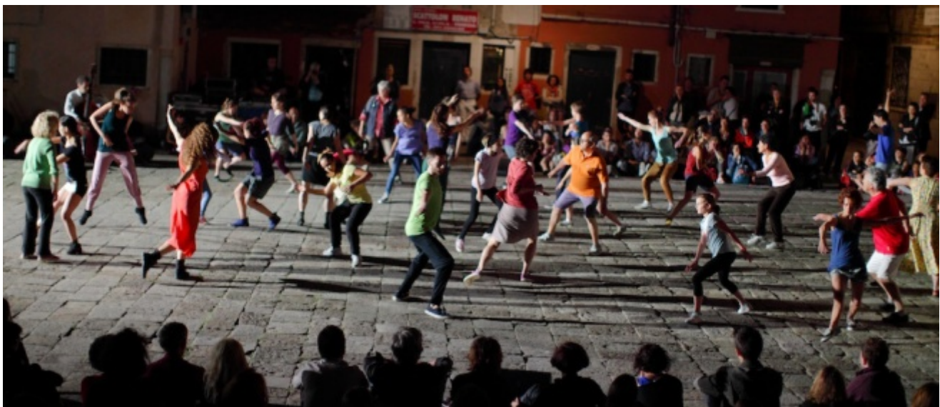
AgorÃ, Biennale Danza 2013