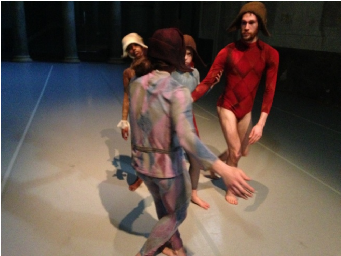
Il seme del piangere

Il finale ci conduce negli ultimi sviluppi, con la danza che alterna concentrate creazioni della compagnia e attività dell'Accademia sull'arte del gesto, aperta ai non professionisti, dove si esplorano i magazzini della memoria. La ricerca sulle radure dell'apparizione dell'archeologia del corpo e del confronto con quel patrimonio che la conserva, tramanda e contiene, che può essere iconografia pittorica (un'iconografia per Sieni toscana e fiorentina, tra Masaccio e Pontorno) si connette con la memoria incarnata dai vecchi, artigiani, partigiani, nonne, con lo slancio, la freschezza di danzatrici bambine, con i corpi normali di persone comuni. Il punto di incrocio diventano le grandi creazioni degli ultimi anni: le agorà nelle quali il gesto del singolo diventa ascolto degli altri, nell'utopia di un paesaggio umano diverso, che trasformi il quotidiano con la sfida della bellezza; le creazioni con madri e figli; i cenacoli, le Botteghe, le Visitazioni realizzate a Firenze, in Toscana e altrove; le stazioni del Vangelo montate per la Biennale di Venezia; la Cena Pasolini bolognese, molte altre occasioni in vari luoghi d'Italia e l'ultima, travolgente realizzazione, la Divina Commedia a Palazzo Vecchio a Firenze ( vedi una descrizione ampia qui ).