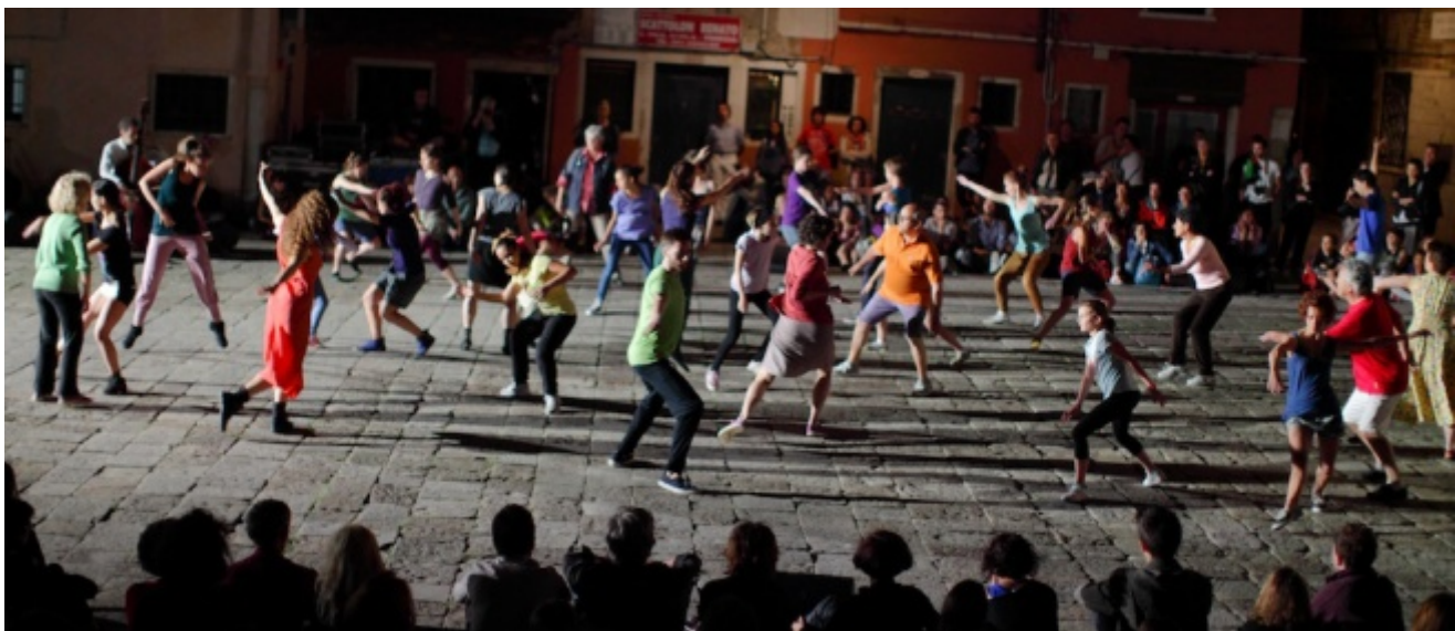
Agorà, Biennale Danza 2013

Rossella Mazzaglia, studiosa di teatro e di danza, ha licenziato in marzo, subito prima di un vero e proprio nuovo tour de force creativo dell'artista, un volume che ne ripercorre la storia, le ricerche, le idee, la carriera. Il titolo Virgilio Sieni. Archeologia di un pensiero coreografico ( Editoria & Spettacolo ) contiene già molti degli elementi in tensione nel racconto e nell'analisi: la personalità di Sieni, il suo impegno inventivo nella