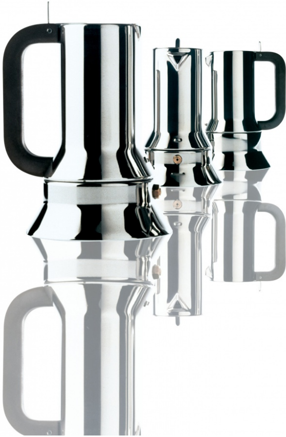
Dall'alto: Bollitore 9091, Alessi. Design di Richard Sapper, 1983; Caffettiera 9090, Alessi. Design di Richard Sapper, 1979. Premio Compasso d'Oro