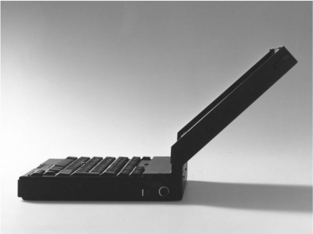
Dall'alto: Telefono Grillo, Siemens. Design di Zanuso e Sapper, 1966 Premio Compasso d'Oro; Lampada Tizio, Artemide. Design di Richard Sapper, 1972. Premio Compasso d'Oro e iF Design Award; ThinkPad 700c, IBM. Design di Richard Sapper, 1992