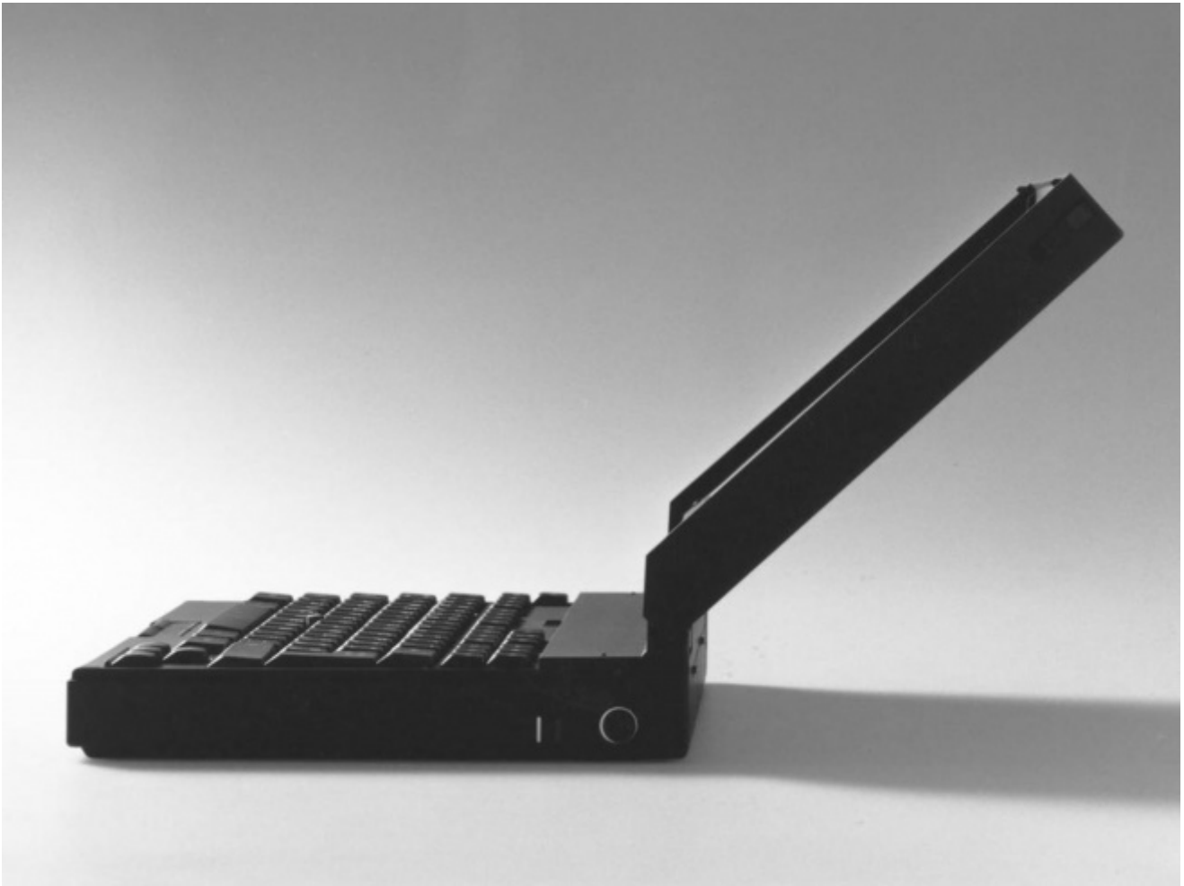
Dall'alto: Telefono Grillo, Siemens. Design di Zanuso e Sapper, 1966 Premio Compasso d'Oro; Lampada Tizio, Artemide. Design di Richard Sapper, 1972. Premio Compasso d'Oro e iF Design Award; ThinkPad 700c, IBM. Design di Richard Sapper, 1992

Ha incarnato tra gli anni Sessanta e i Novanta una delle prerogative della produzione: creare oggetti belli seguendo il problem-solving : dare un senso alla forma, la bellezza quale risultato dell'utilità. Se si va a rivedere la serie dei televisori e delle radio disegnate con Marco Zanuso negli anni Sessanta, per Brionvega (i televisori Black , Algol , Doney , la radio portatile bivalente TS 502 ), oppure lo straordinario telefono Grillo , antenato dei cellulari, si scopre che Sapper ha interpretato al meglio l'idea di una linea italiana fondata su un'industria che coniugava artigianato e produzione in serie, qualità e quantità. Ernesto Gismondi, proprietario di Artemide, riferisce che un giorno del 1970 il designer tedesco-italiano gli telefonò per dirgli: "Ti ricordi che mi avevi chiesto di disegnarti una lampada estremamente funzionale e innovativa?". Tizio è una delle prime lampade a utilizzare una lampadina alogena a basso consumo. Ogni soluzione estetica è per Sapper fondata sull'efficacia. Ha anche lavorato per IBM, progettato vari computer. Il suo più famoso è Think paf , pensato in collaborazione con un