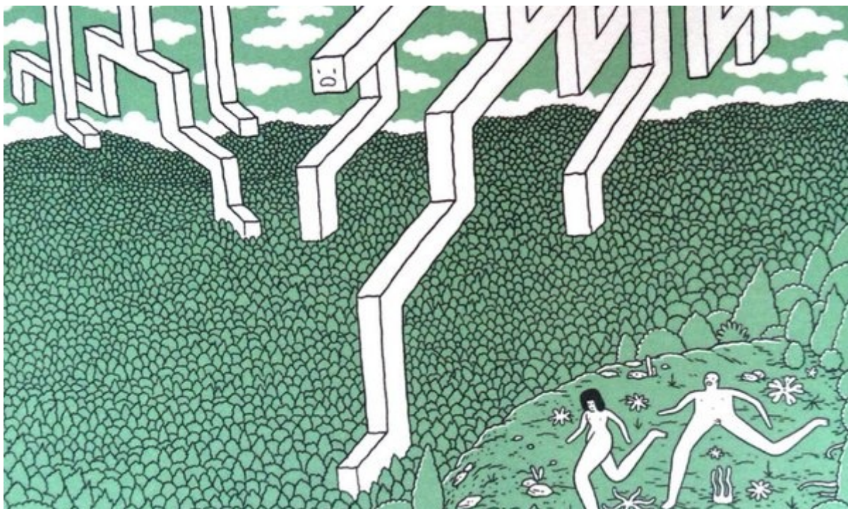
Safari Honeymoon, di Jeff Jacobs