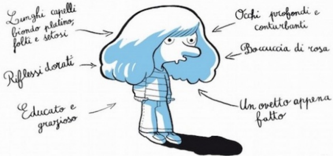
L'Arabo del Futuro, di Riad Sattouf

Mi chiamo Riad. Nel 1980 avevo due anni ed ero un uomo dei sogni.