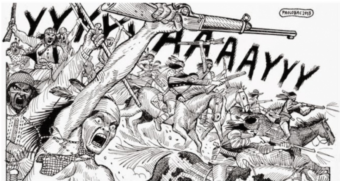
Il prezzo dell'onore, disegni di Paolo Bacilieri