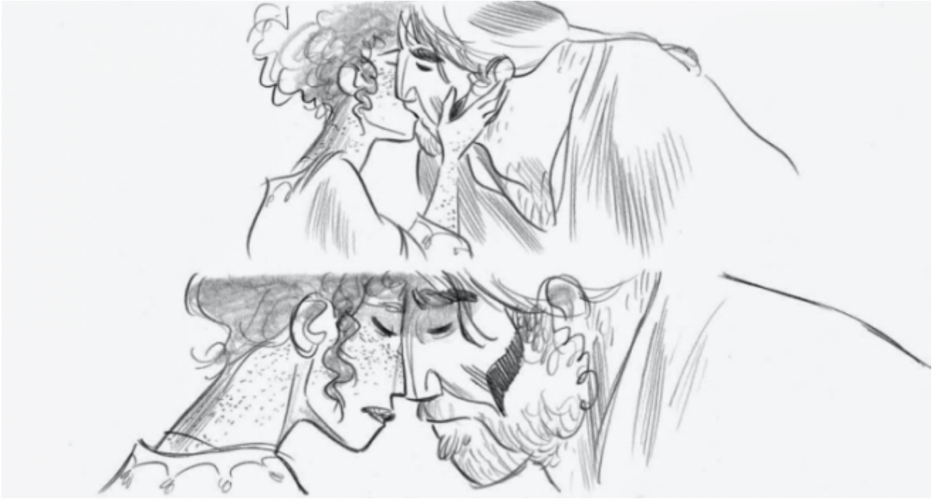
Il porto proibito, disegni di Stefano Turconi