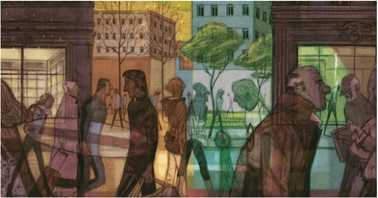
Gli equinozi, di Cyril Pedrosa