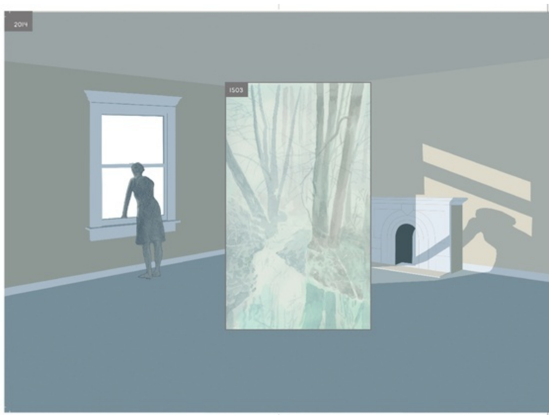
Qui, di Richard McGuire