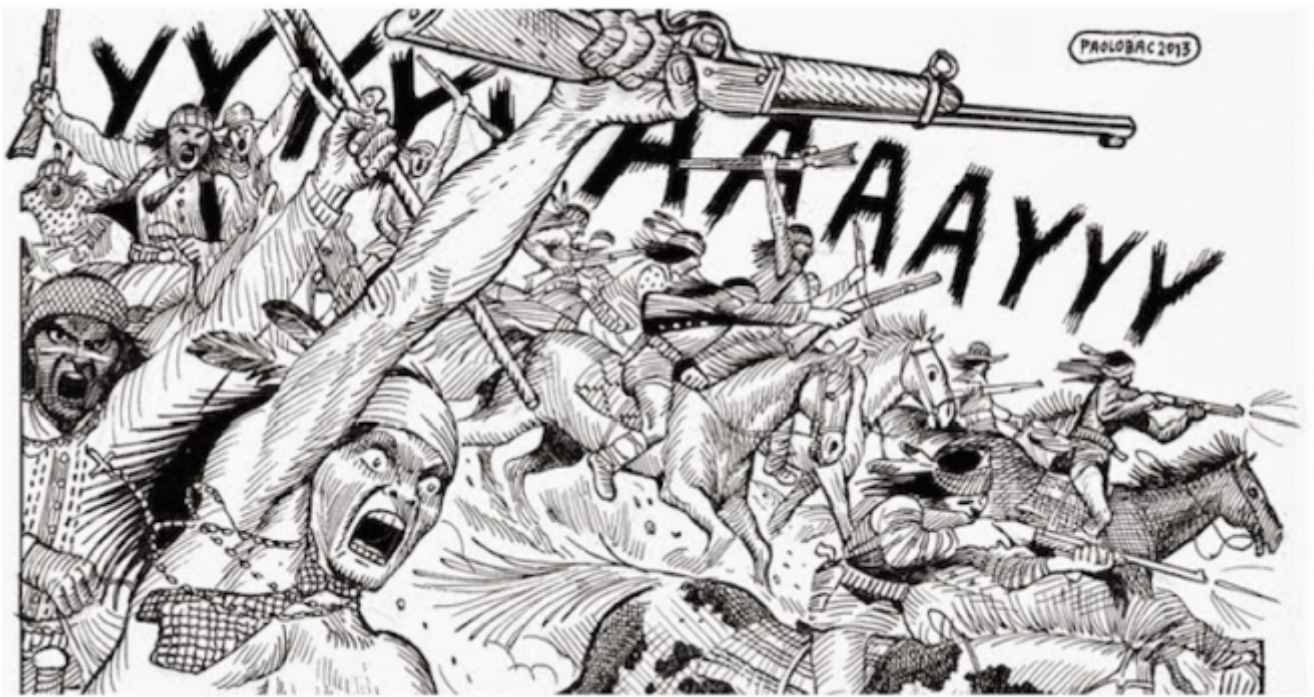
Il prezzo dell'onore, disegni di Paolo Bacilieri