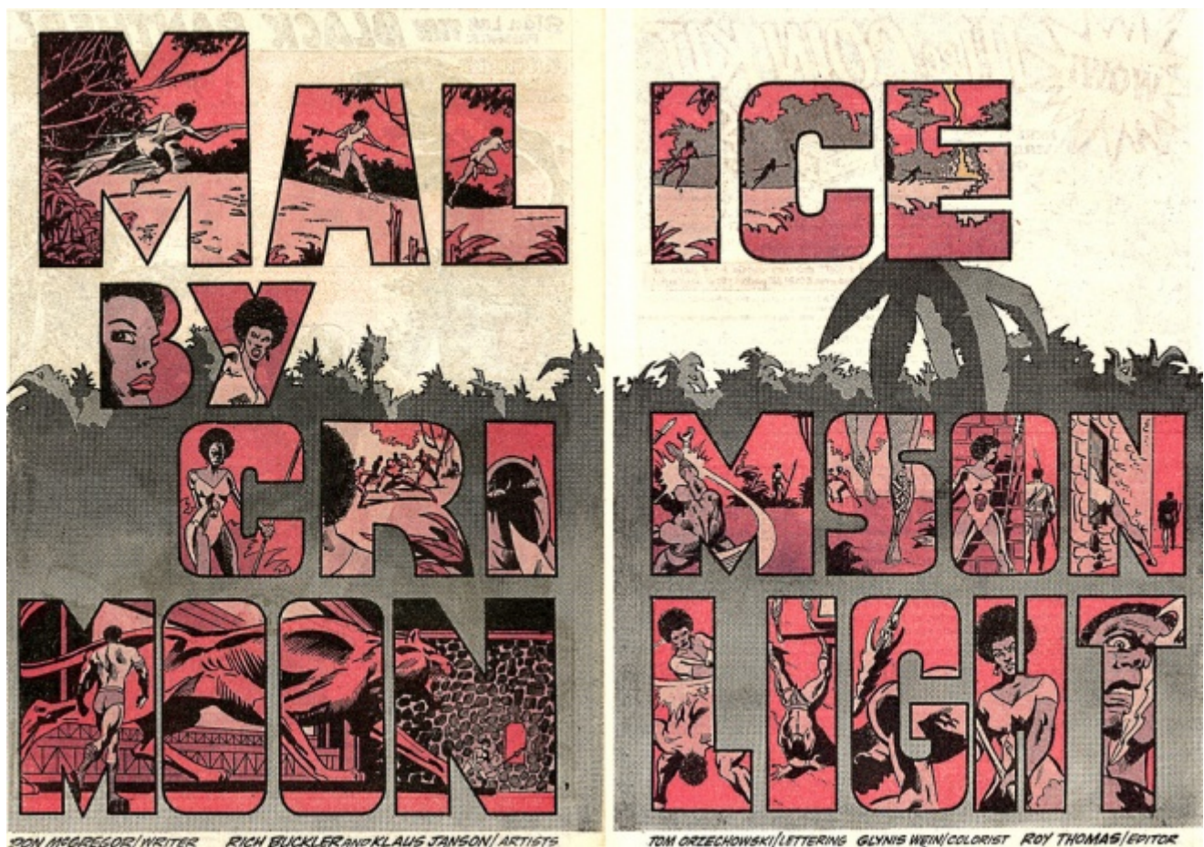
Pantera Nera, disegni di Rich Buckler, Billy Graham, Gil Kane, Keith Pollard

che non leggerete il “solito” fumetto di supertizi in calzamaglia.