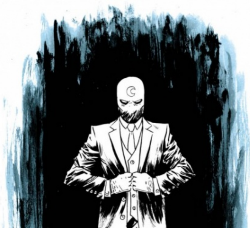
Moon Knight - Dalla Morte, disegni di Declan Shalvey