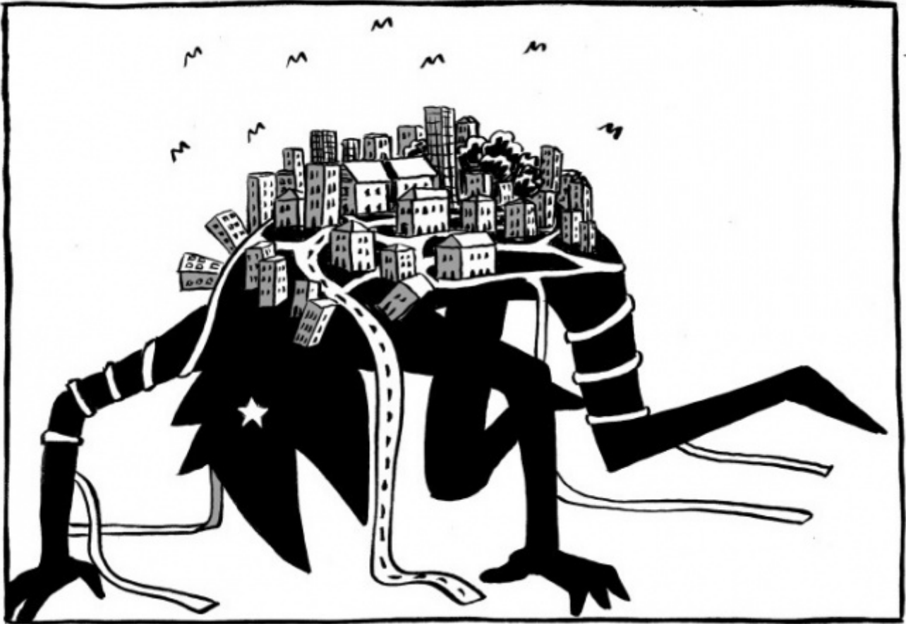
Anubi, disegni di Simone Angelini