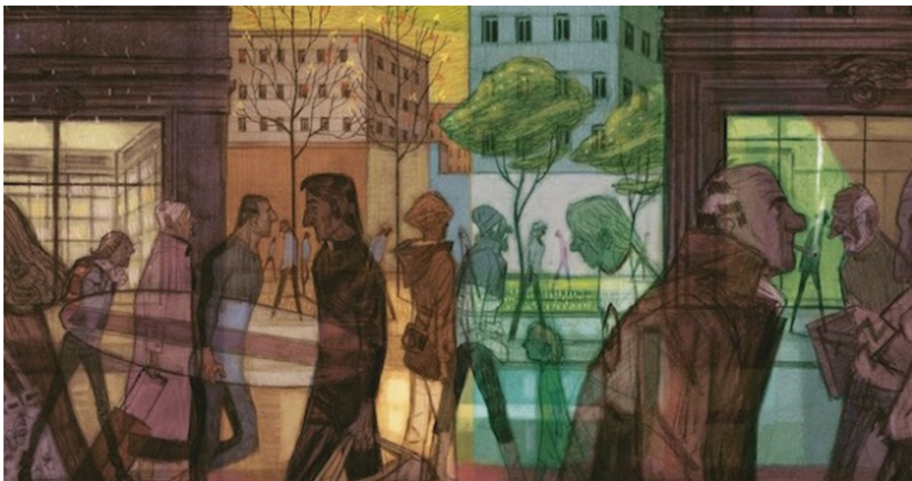
Gli equinozi, di Cyril Pedrosa