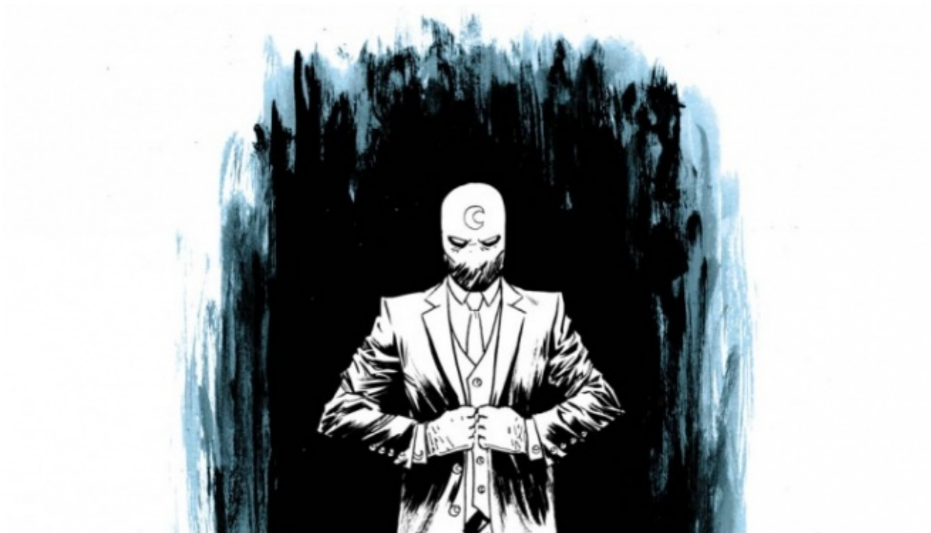
Moon Knight - Dalla Morte, disegni di Declan Shalvey

Uno dei pregi di un mercato fumettistico italiano “maturo” e articolato come quello attuale è certamente quello di aver permesso anche a opere più oscure e di nicchia di ritornare disponibili spesso in edizioni rinnovate e curatissime. È il caso di questa splendida ristampa di un ciclo di storie di Pantera Nera, un vero classico del fumetto americano. Pubblicate originariamente fra il '73 e il '76 queste oltre 300 pagine rappresentarono all'epoca un concentrato di innovazione senza precedenti. Furono innanzitutto il primo fumetto dedicato a un eroe di colore. Oltre a questo per primo McGregor sperimentò la forma dei grandi archi narrativi che si dispiegavano di numero in numero in questo caso per oltre 3 anni. Il tutto fu possibile grazie alla complicità di Roy Thomas, all'epoca supervisore capo della Marvel, che credeva profondamente in un progetto così controcorrente. Grazie al talento visivo di disegnatori come Graham e Colan, il realismo de “ La rabbia della pantera ” con scade mai nel didascalismo sociologico ma diventa avventura epica e politica con un fine lavoro psicologico. E quando ci si trova di fronte a episodi con titoli come “ All Our Past Decades Have Seen Revolutions ! ” e “ Thorns in the Flesh, Thorns, in the Mind ” vi posso assicurare che non leggerete il “solito” fumetto di supertizi in calzamaglia.