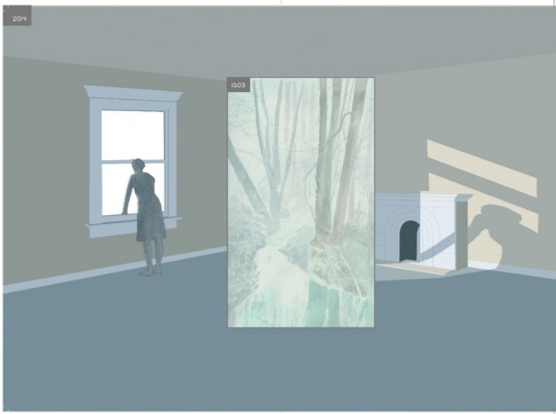
Qui, di Richard McGuire