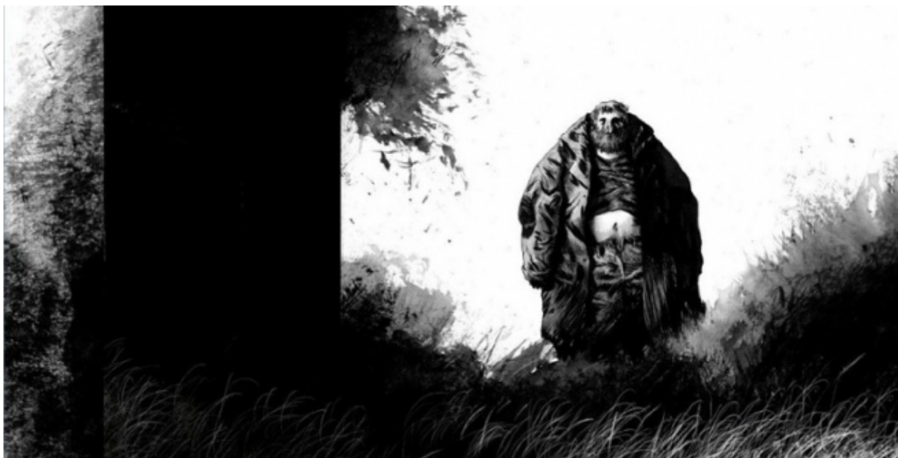
Blast, di Manu Larcenet