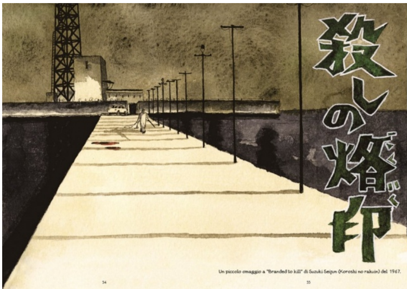
Quaderni giapponesi, di Iğort