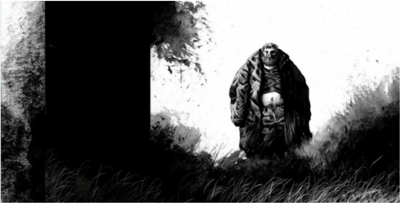
Blast, di Manu Larcenet