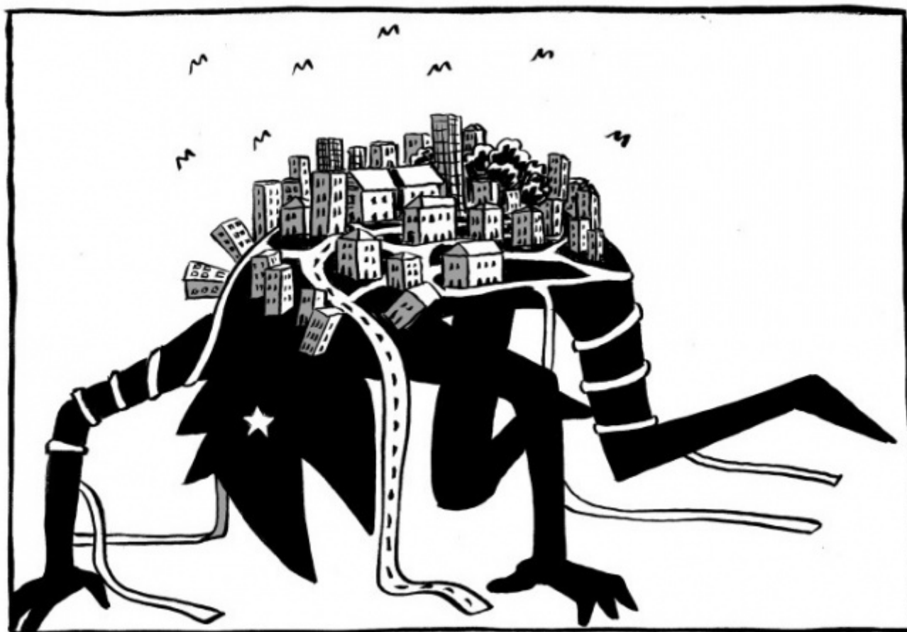
Anubi, disegni di Simone Angelini

La vera sorpresa del 2015. Un'opera prima ambiziosa e fuori dagli schemi per raccontare le peripezie di Anubi, divinità egizia che da troppi secoli non torna fra le piramidi e preferisce oziare e forse soffrire in un piccolo paesino della provincia italiana. Ci sono il bar, la droga, la solitudine, l'assurdo. C'è un umorismo brutale e delle improvvise sterzate di lirismo che lasciano senza fiato. E poi c'è uno dei finali più belli fra quelli letti quest'anno. Lunga vita ad Anubi. Adesso però passatemi un altro Campari.