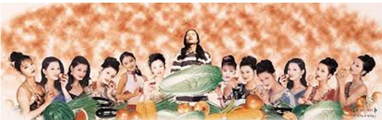
Dall'alto: Wang Quingsong, The Last Supper ; Dormitory