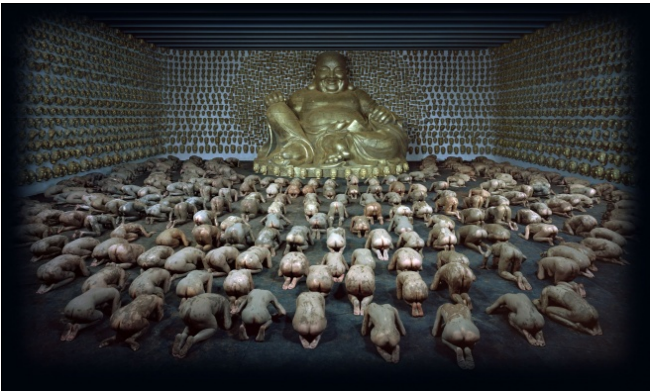
Wang Qingsong, Temple