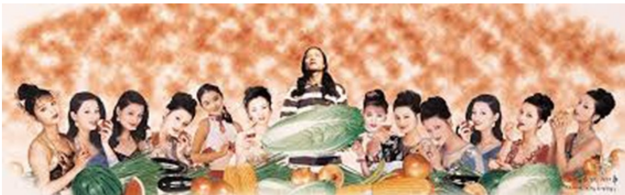
Dall'alto: Wang Quingsong, The Last Supper ; Dormitory

Tuttavia, ci sono luoghi nel mondo in cui all'artista e all'intellettuale spettano ancora il dovere morale di porsi criticamente nei confronti dello status quo , soprattutto quando le autorità esercitano il loro potere in maniera opaca e coercitiva. L'arte sperimentale cinese, i cui incunaboli risalgono alla fine degli anni '70,