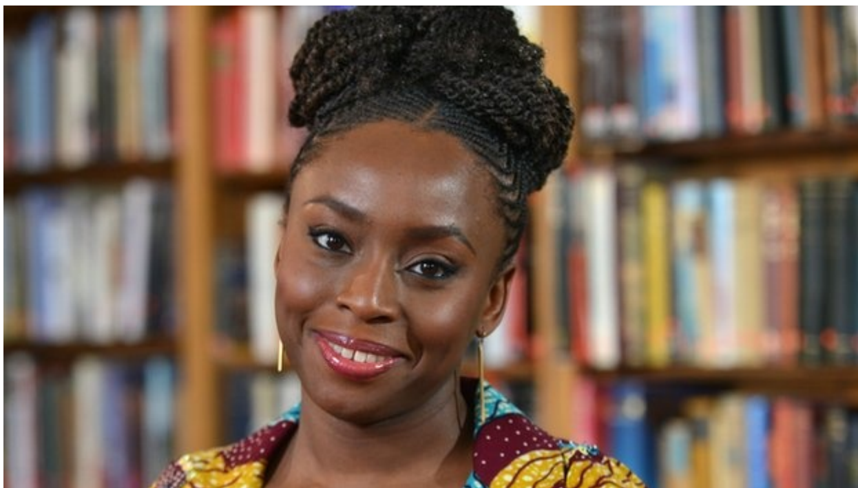
Chimamanda Ngozi Adichie

Americanah ha ottenuto il National Book Critics Circle Award e molte altre menzioni, tra cui quella di uno dei cinque migliori romanzi del 2013 sul New York Times.