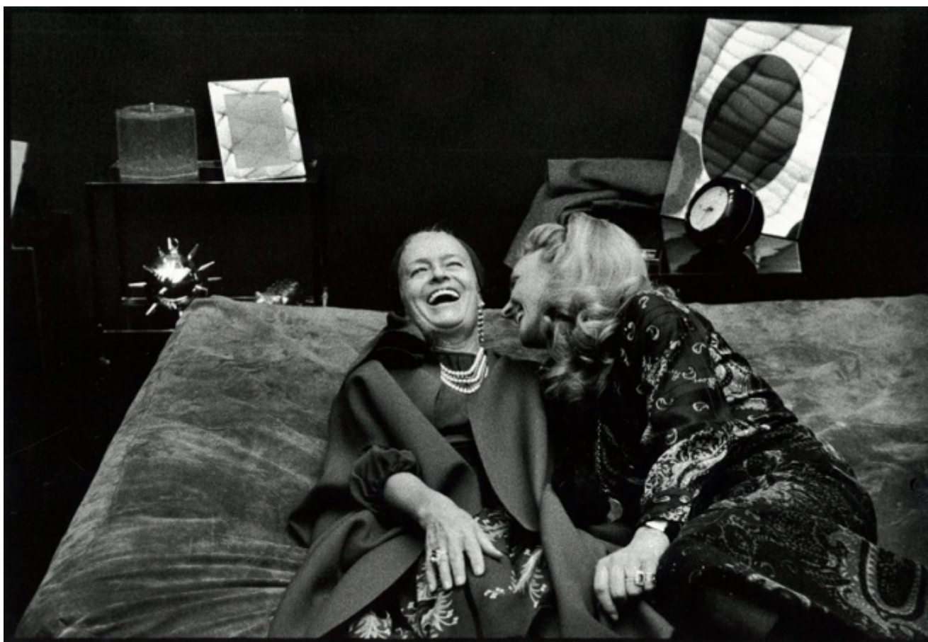
Carla Cerati, Senza titolo (Inaugurazione del negozio di arredamento di Nucci Valsecchi e Willy Rizzo a Milano, dalla serie "Mondo Cocktail"), s.d. (1970)