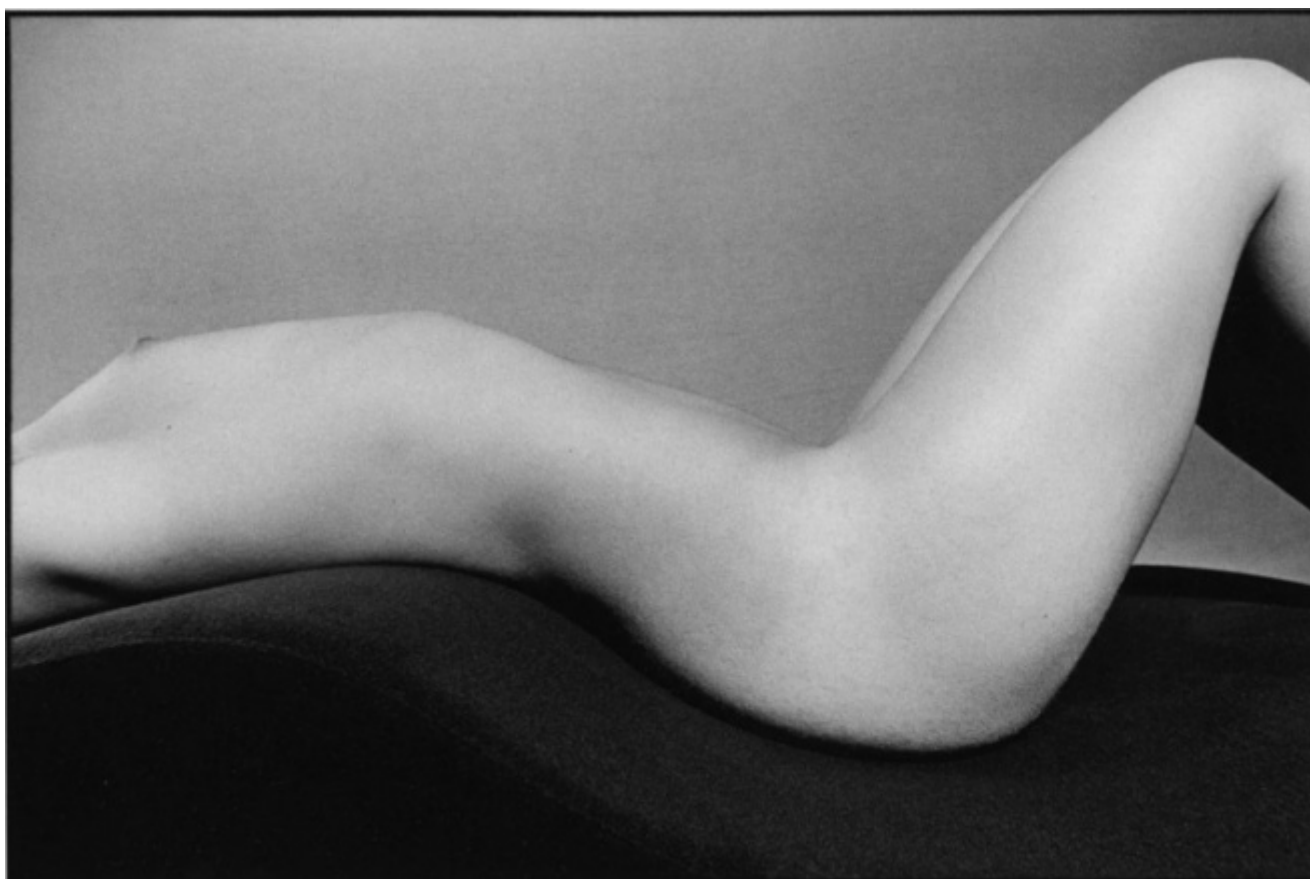
Carla Cerati, Senza titolo , (dalla serie "Nudo di donna"), s.d. (1973)

E poi i foyer della Scala, i mutamenti della città e le sue ferite nel ciclo intitolato Milano Metamorfosi (duecentodiciassette fotografie divise in capitoli come un romanzo), le lotte studentesche, i funerali di Giangiacomo Feltrinelli e degli studenti uccisi negli anni Settanta, il processo Calabresi-Lotta Continua, il mondo della scuola, quello delle balere degli immigrati nella vecchia Milano, i ritratti degli intellettuali: Eugenio Montale, Elio Vittorini, Italo Calvino, Pier Paolo Pasolini.