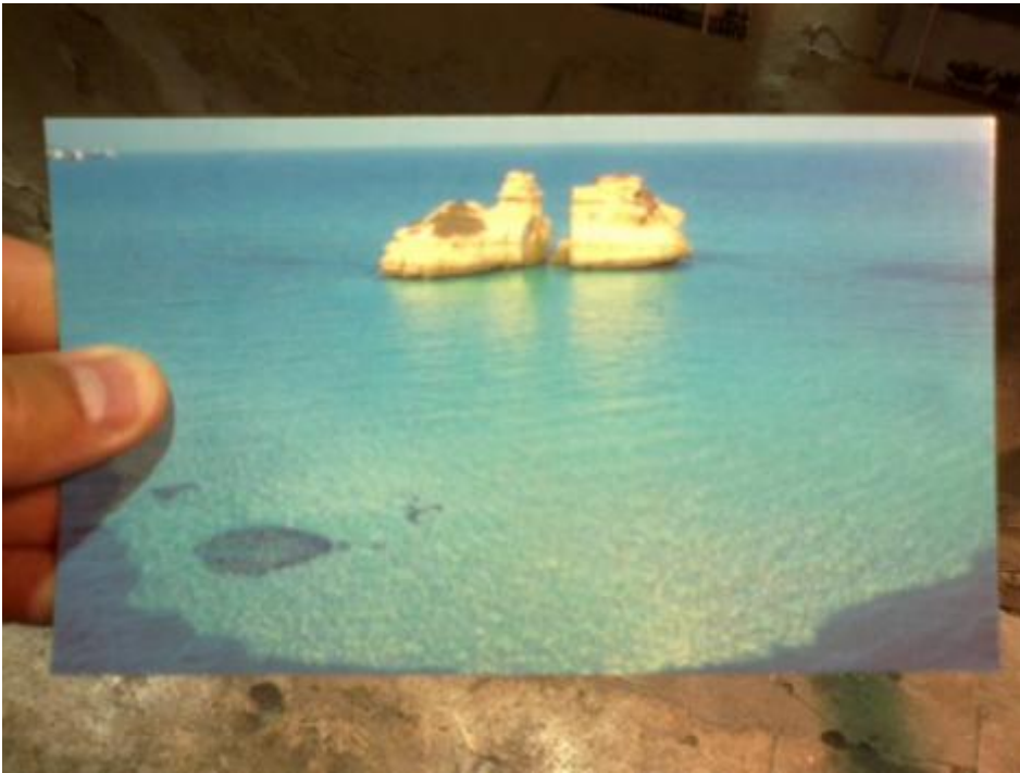
Due sorelle a Melendugno