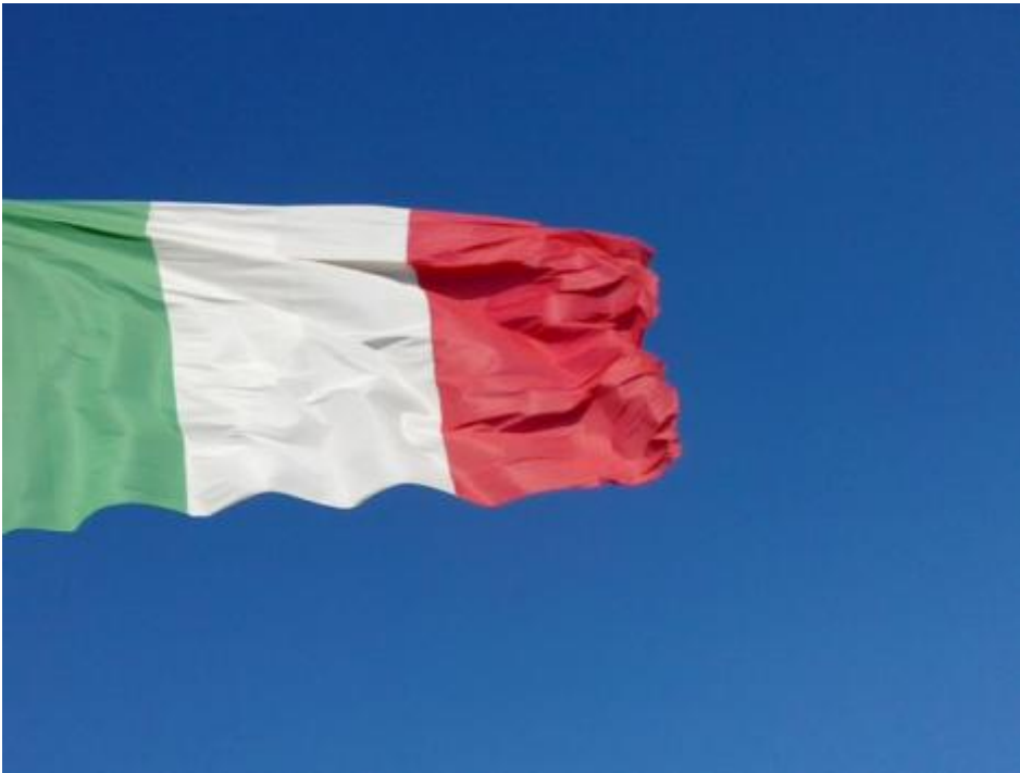
Santa Maria di Leuca. De finibus terrae