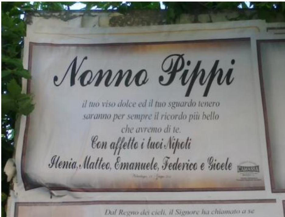
Con affetto i tuoi nipoti