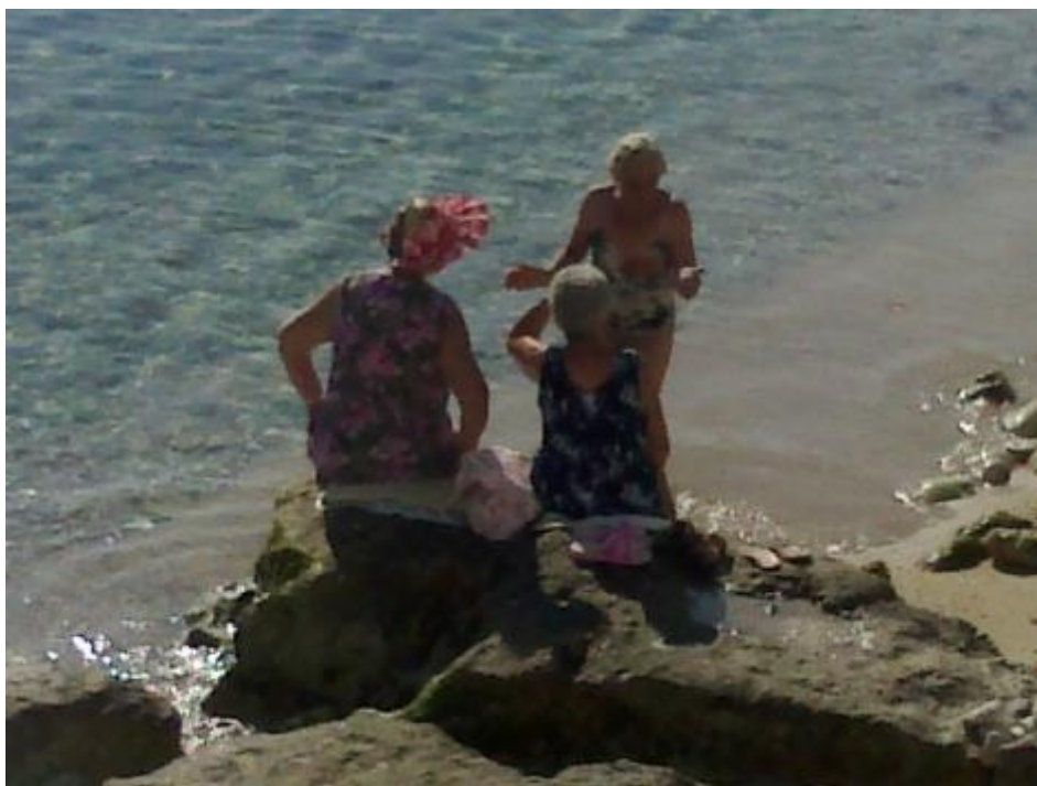
Care signore di Monopoli