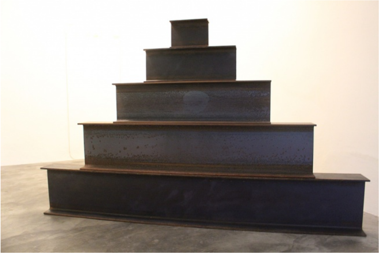
Martin Creed, Work No. 1638, 2013

Altra opera che Creed ha deciso di ripresentare per la mostra a Base Ã Work No. 1638, del 2013, una struttura modulare a ziggurat , costituita da cinque longarine in ferro che si rastremano progressivamente verso lâ?alto: posta in maniera obliqua allâ?interno degli spazi espositivi, lâ?opera, nella sua elementaritÃ e definizione, da una parte si caratterizza come realtÃ segnica autonoma e autoevidente, dallâ?altra come elemento di rottura, ma dâ?interazione, nella linearitÃ del percorso espositivo. La ripetizione dei motivi romboidali del Wall Painting sembrano infine accompagnare chi guarda sino alla parete di fondo della galleria, dove il punto di fuga viene a coincidere con Work No. 672, Friend , unâ?installazione al neon del 2007, tanto fisica quanto rarefatta, tanto ermetica quanto evasiva, tesa a suscitare significati senza mai affermarli: segno e simbolo di quella che oggi viene identificata come estetica relazionale , il cui substrato generativo, per citare Nicolas Bourriaud, resta lâ?intersoggettivitÃ . La mostra, presso gli spazi della vivida realtÃ di BASE in San NiccolÃ a Firenze, sarÃ visitabile ancora per qualche settimana, oltre la data ufficiale di chiusura.