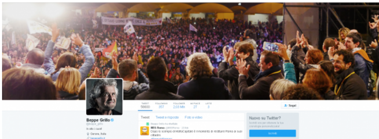
Grillo su Twitter

un padre per confortare i figli, ruolo che Grillo sembra voler ricoprire con i suoi seguaci, anche se Mario Bordin, in un suo pezzo del 2013 su Il foglio , ha ricollegato il motto all'inno delle camicie brune. Rimanendo nel campo della retorica del pater familias, un ulteriore spunto d'analisi proviene dalla copertina, che vede in primo piano una folla adulante di pentastellati, mentre Grillo e gli altri esponenti del partito-non-partito sono ripresi di spalle, intenti ad applaudirli. Se triangoliamo questa immagine, “in alto i cuori” e la risposta dell'assemblea “sono rivolti al Signore”, l'equazione è presto fatta: Grillo sta ai suoi seguaci come il buon pastore alle sue pecorelle. Fedez come Grillo continua con l'accoppiata sostenitori più foto personale, per dimostrare che loro sono la gente e la gente è loro, in tutti i sensi.