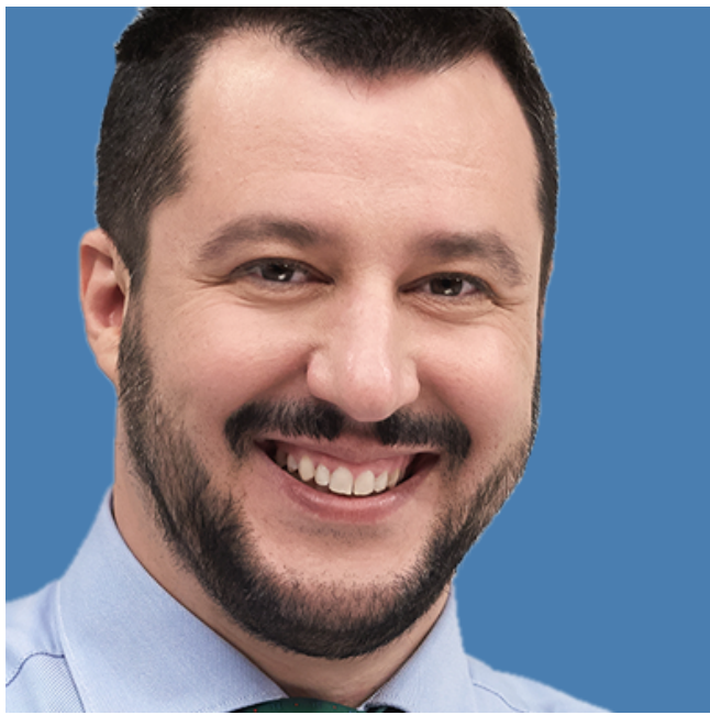
Gasparri e Matteo Salvini su Twitter

La bio di Matteo Salvini balza dalla terza alla prima persona, sintomo di un bipolarismo auto-comunicativo, ed è sicuramente più particolareggiata negli incarichi rispetto a quelle dell'altro Matteo e di Gasparri.