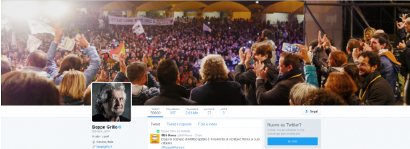
Grillo su Twitter

userebbe un padre per confortare i figli, ruolo che Grillo sembra voler ricoprire con i suoi seguaci, anche se Mario Bordin, in un suo pezzo del 2013 su Il foglio , ha ricollegato il motto all'inno delle camicie brune. Rimanendo nel campo della retorica del pater familias, un ulteriore spunto d'analisi proviene dalla copertina, che vede in primo piano una folla adulante di pentastellati, mentre Grillo e gli altri esponenti del partito-non-partito sono ripresi di spalle, intenti ad applaudirli. Se triangoliamo questa immagine, è in alto i cuori? e la risposta dell'assemblea sono rivolti al Signore? l'equazione è presto fatta: Grillo sta ai suoi seguaci come il buon pastore alle sue pecorelle. Fedez come Grillo continua con l'accoppiata sostenitori più foto personale, per dimostrare che loro sono la gente e la gente è loro, in tutti i sensi.