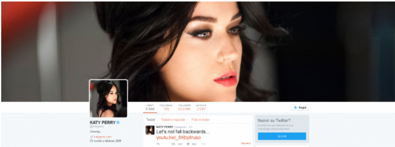
Katy Perry su Twitter

La maggior parte opta per le immagini del profilo con il faccione in primo piano, dove le opposizioni in gioco sono: istituzionale vs finta sorpresa, comicità spinta vs ammiccamento andante. Ci sono anche casi di piano medio e figura intera, ma si tratta di fotografie più elaborate.