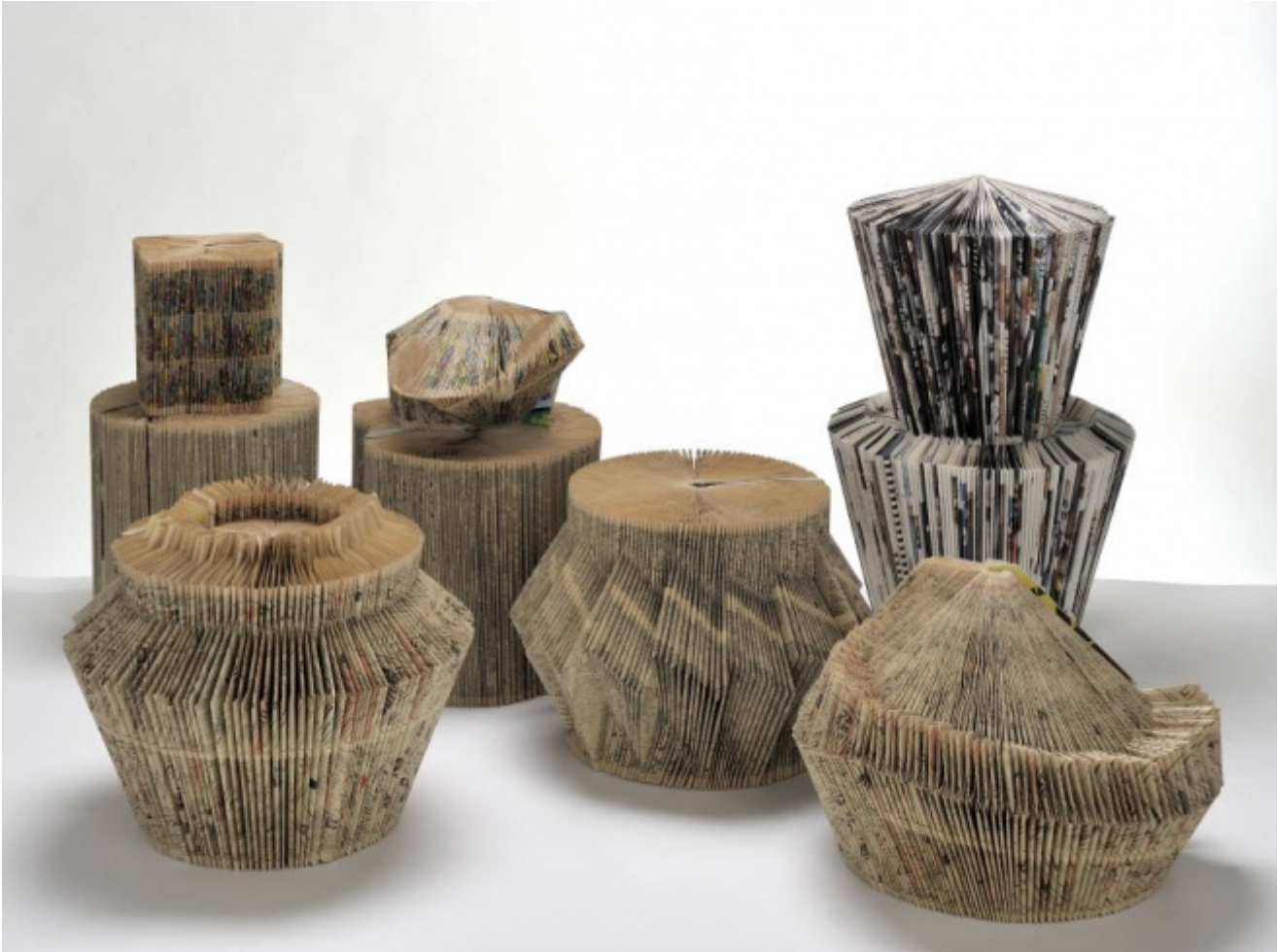
Stefano Arienti, Senza Titolo Turbine (1990)

scrive Pincio, dell'identità. Una conquista che se passa simbolicamente attraverso la morte e la trasfigurazione delle personalità, appare, anziché come un rassicurante, definitivo approdo, come l'apertura di una ulteriore, non meno problematica stagione sperimentale, come un agone in cui riappare in filigrana, ancora Cortellessa a scriverlo nella sua postfazione, la secolare, fraticida rivalità, tra la penna e il pennello, tra pittori e scrittori.