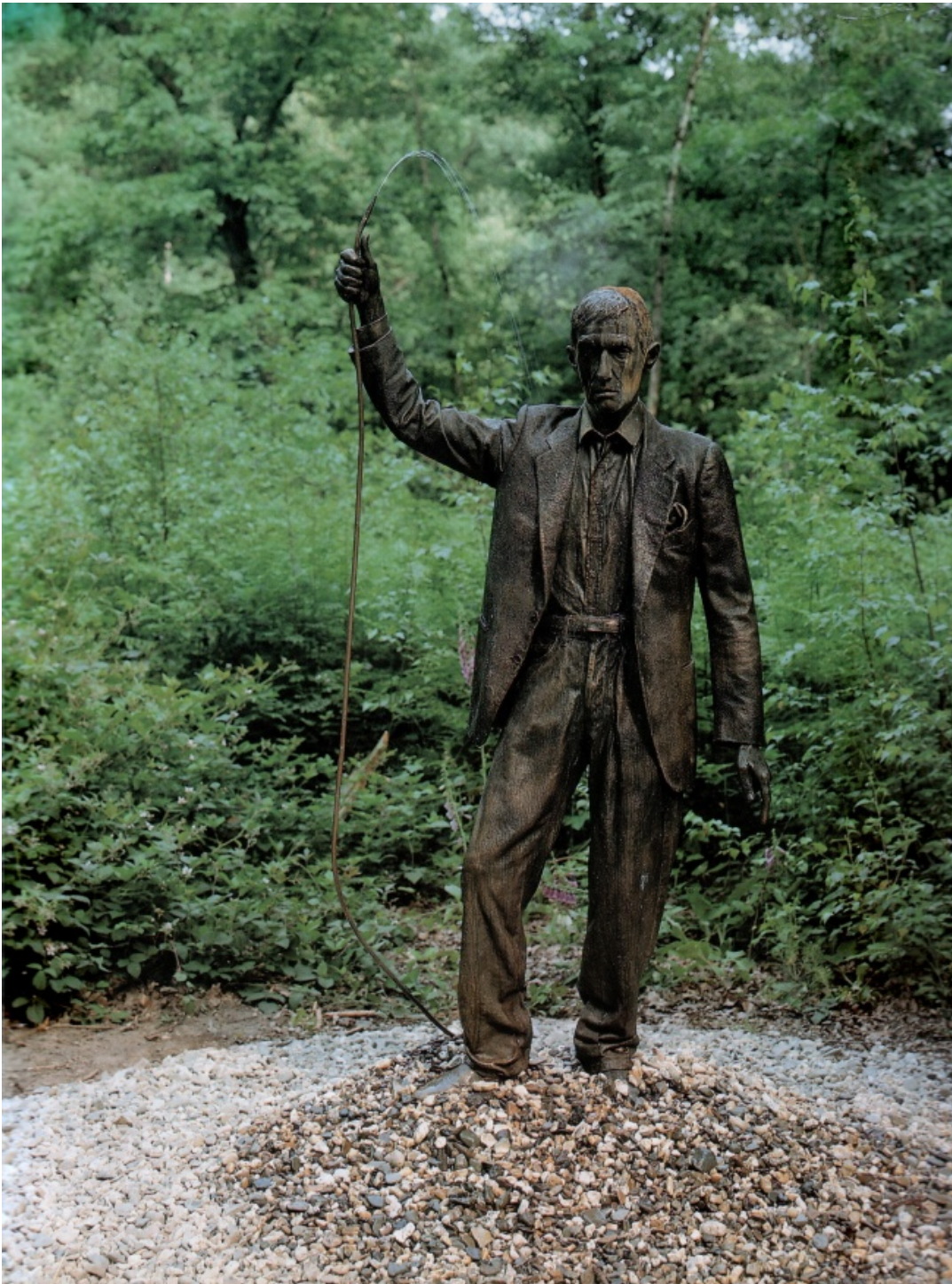
Alighiero Boetti, Autoritratto (1993)

Ovvero, e solo in apparenza per serendipity , una resa dei conti al tempo stesso esistenziale e letteraria con i diversi Io che hanno nel tempo abitato, alcuni simultaneamente, altri allo stato latente, la vita dell'autore: studente dell'accademia di belle arti, aspirante pittore, e assistente di altri artisti, gallerista, critico d'arte, curatore, e finalmente scrittore. Una vicenda che il lettore è chiamato oggi a osservare come una di quelle stratigrafie usate dagli archeologi per studiare le trasformazioni successive di uno stesso luogo, abitato magari ininterrottamente dalla preistoria al tempo presente. Un palinsesto, in altre parole, in cui la scrittura (e la riscrittura, a sottrarre almeno, dato che i testi raccolti nel libro hanno subito diverse sforbiciature) illumina di una luce retrospettiva, quasi sempre ironica, a volte tagliente, ma sempre con sottigliezza, eventi grandi e minimi, le figure essenziali o di contorno, i moventi espliciti e quelli meno confessabili del protagonista, in un panorama in cui l'intreccio difficile, inevitabile, tra vocazione, abbaglio, ispirazione, errore,