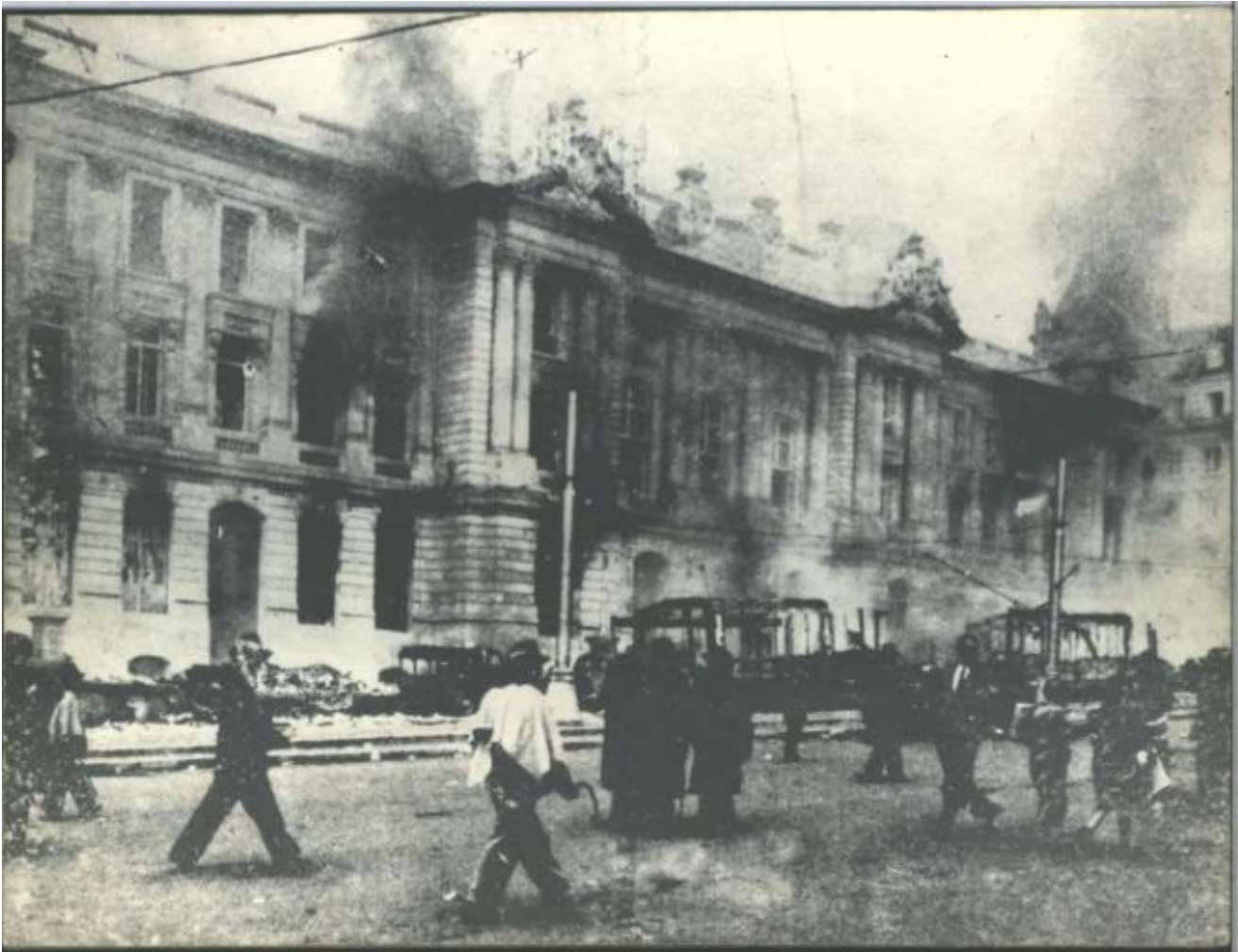
Una delle immagini piÃ¹ rappresentative del Bogotazo, la rivolta popolare scatenata dall'uccisione di Jorge EliÃ©cer GaitÃ¡n.

Sono proprio gli anni immediatamente antecedenti al fragoroso capitolare di un instabile equilibrio politico quelli narrati da Reyes, nella cui sventura riecheggiano le disgrazie di un'intera nazione: â??Ti sembrerÃ strano che io riesca a raccontarti nei dettagli e con tale precisione i fatti di un'epoca cosÃ¬ lontana. Lo penso anche io, un bambino di cinque anni che abbia una vita normale non potrebbe ricostruire con tanta fedeltÃ la propria infanziaâ?• (p. 75).