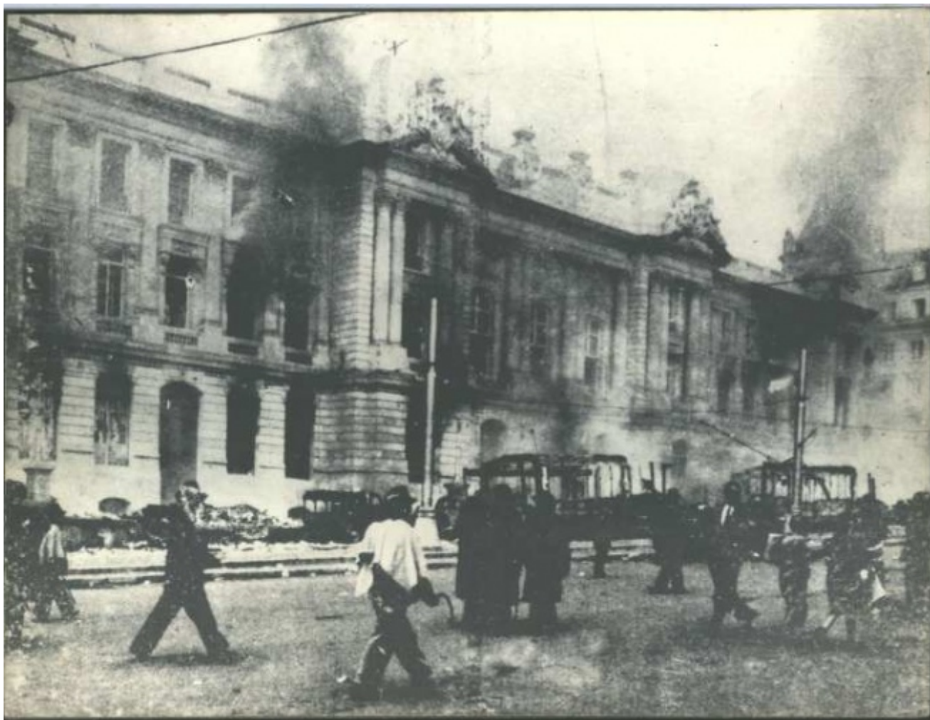
Una delle immagini più rappresentative del Bogotazo, la rivolta popolare scatenata dall'uccisione di Jorge Eliécer Gaitán.

Sono proprio gli anni immediatamente antecedenti al fragoroso capitolare di un instabile equilibrio politico quelli narrati da Reyes, nella cui sventura riecheggiano le disgrazie di un'intera nazione: "Ti sembrerà strano che io riesca a raccontarti nei dettagli e con tale precisione i fatti di un'epoca così lontana. Lo penso anche io, un bambino di cinque anni che abbia una vita normale non potrebbe ricostruire con tanta fedeltà la propria infanzia" (p. 75).