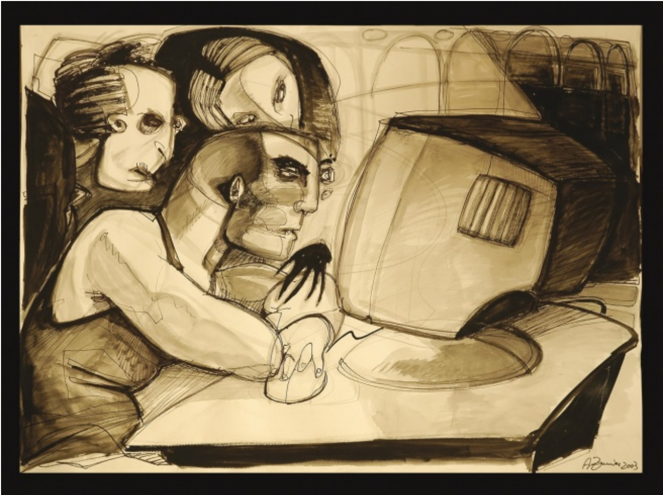
A. Zannier, I cospiratori .

parte dei "poteri forti", politici economici e culturali; quella di destra vede la storia attuale come effetto di cospirazioni delle "sinistre" per dominare il mondo moderno. Il cospiratore "è sempre l'altro", il proprio successo "è invece sempre autentico".