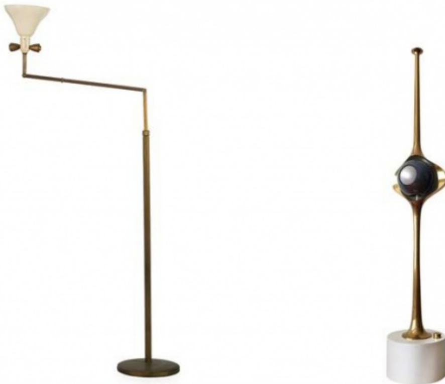
Angelo Lelli, Lampada Tris (1946) e lampada Cobra (1965).

Dopo la forzata interruzione del periodo bellico, nel 1946 su «I Quaderni di Domus» compare la sua prima pubblicità che presenta la «nuova lampada Tris» , in ottone e ghisa, orientabile con tre diversi snodi