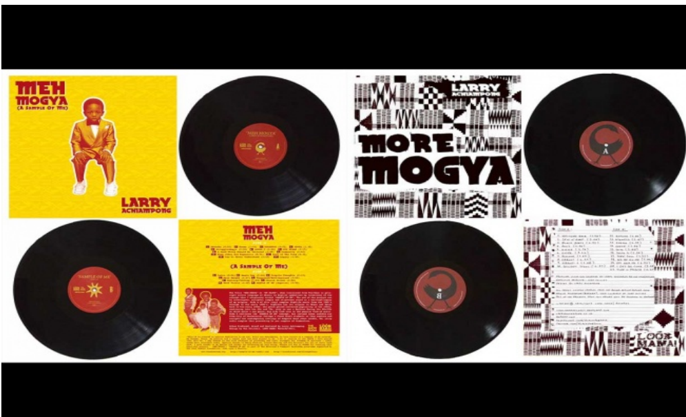
Opere di Larry Achiampong.