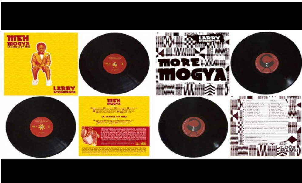
Opere di Larry Achiampong.