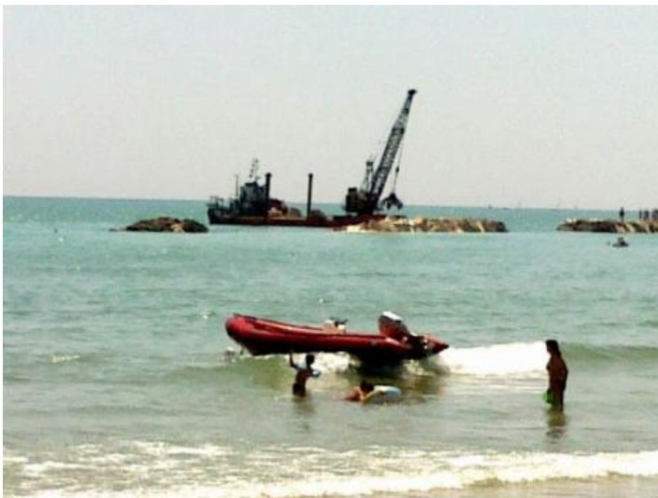
Orizzonte in costruzione