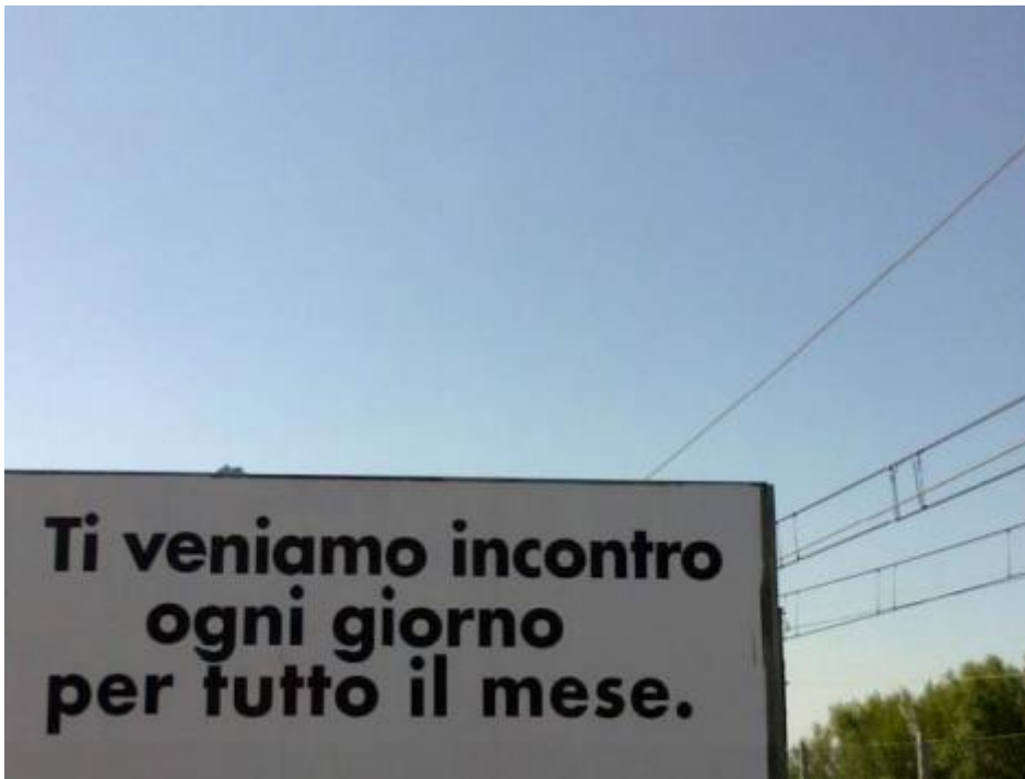
Ogni giorno per tutto il mese