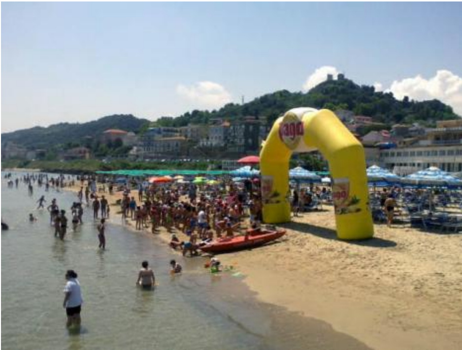
Calypso al Lido