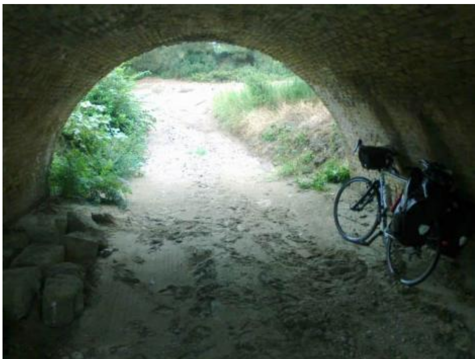
Proprio sotto ad un ponte