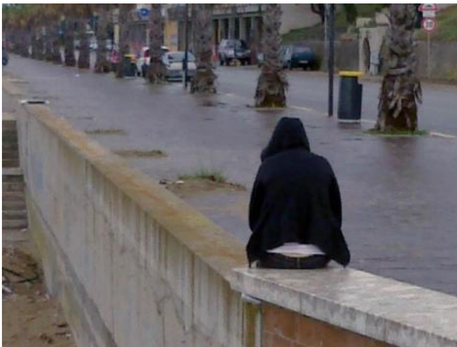
La malinconia a Termoli