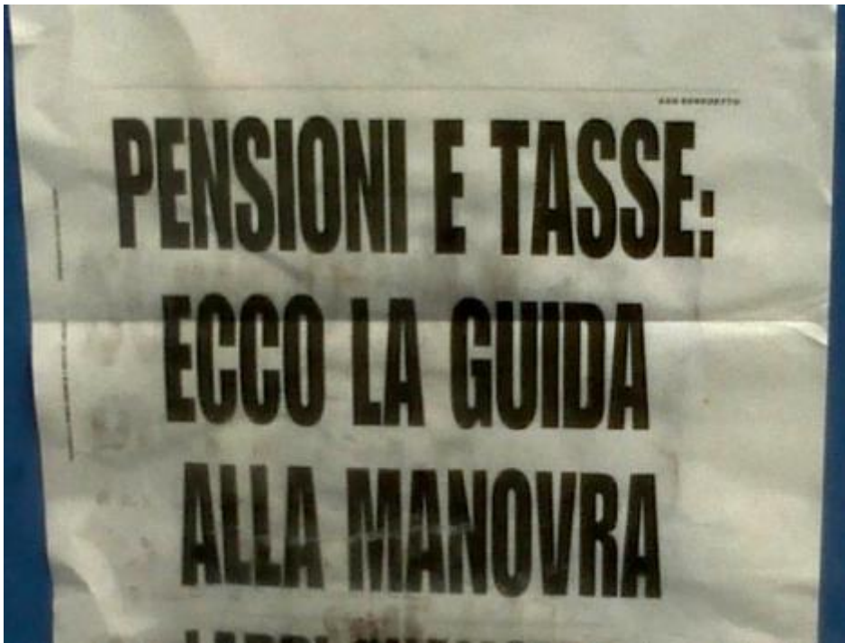
Ecco la guida