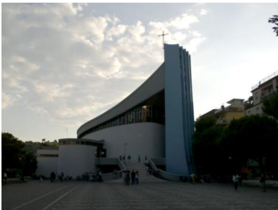
Un trampolino ai fedeli del Molise

Se continuiamo a tenere vivo questo spazio Ã grazie a te. Anche un solo euro per noi significa molto. Torna presto a leggerci e SOSTIENI DOPPIOZERO