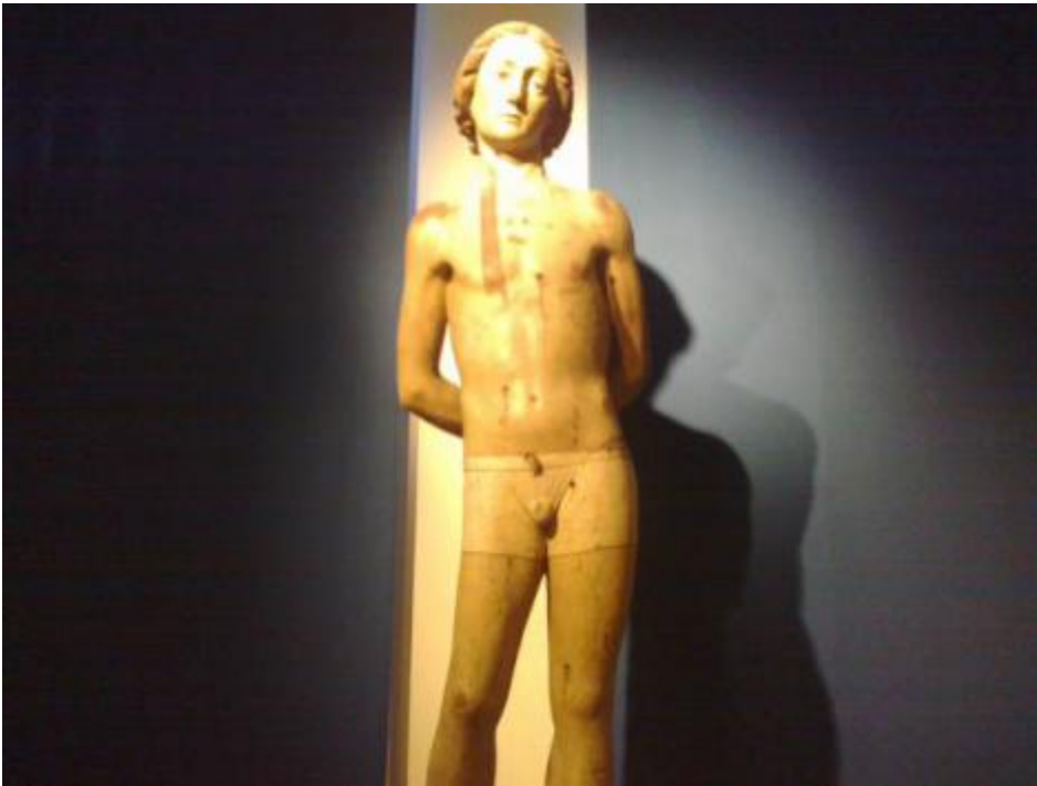
A Fermo i boxer di San Sebastiano.