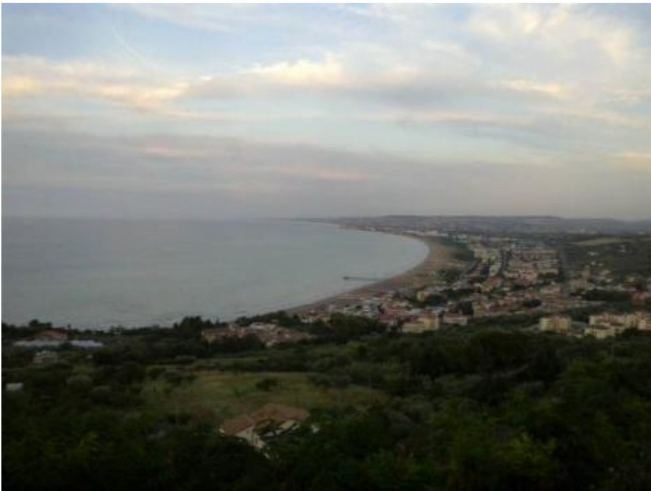
Fermo. E mi fermo.