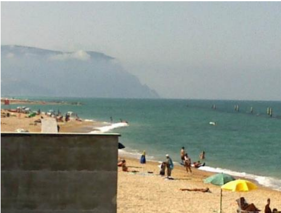
Il Conero dietro a un muro.