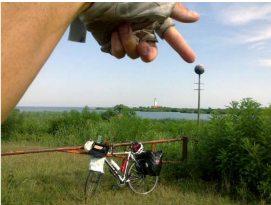
Ritrovare il punto nella foce.