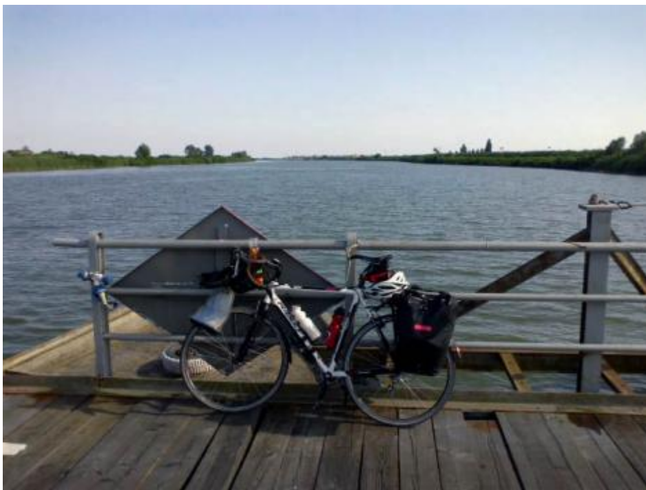
Tra la Romagna e il Veneto un ponte di barche.