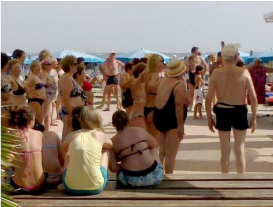
La riviera di mattina.