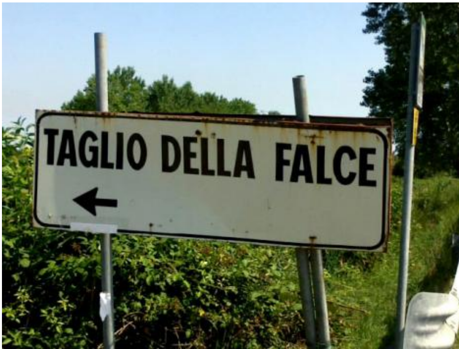
Taglio della falce.