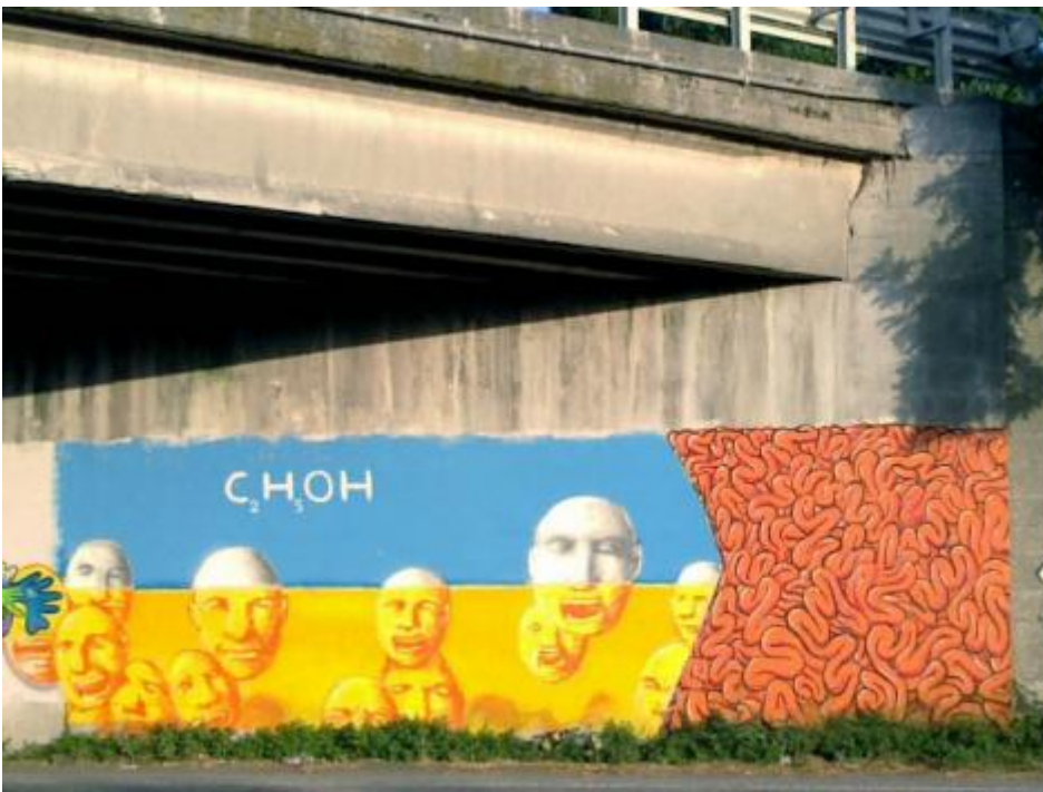
CHOH. A Marina di Ravenna.

Continua Orizzonte in Italia , il giro in bicicletta lungo le coste della nostra penisola: questa tappa ci porta in Emilia Romagna.