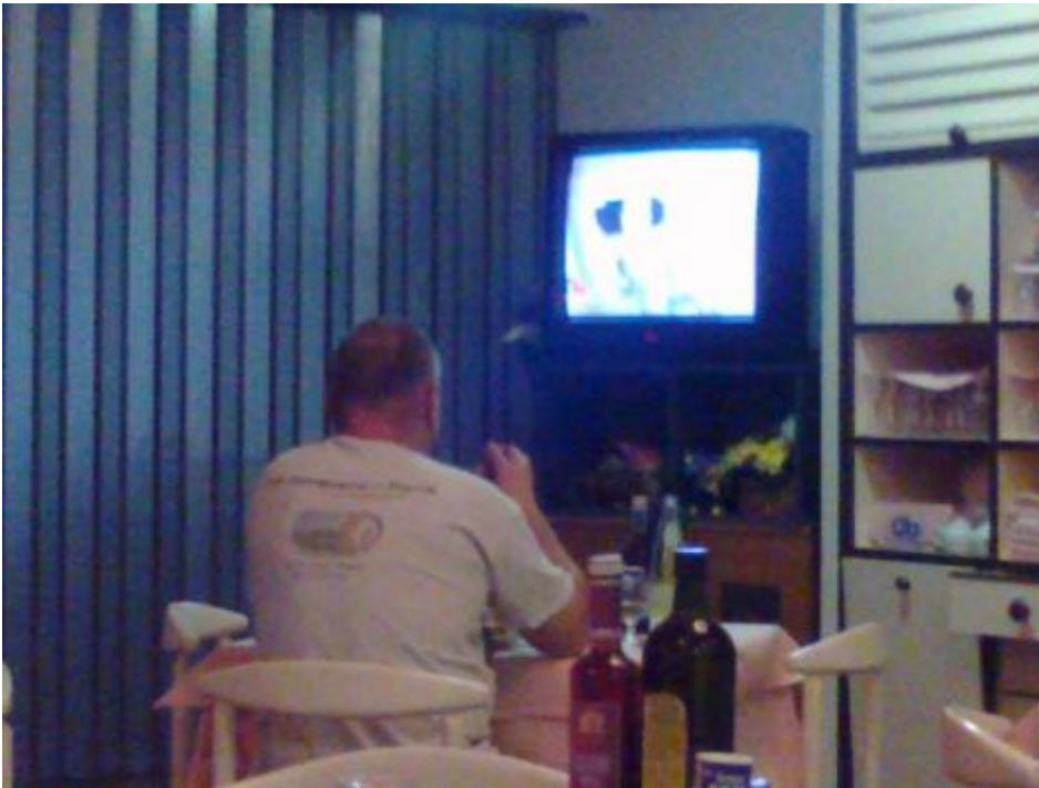
Scherzi a parte ad Aquileia.