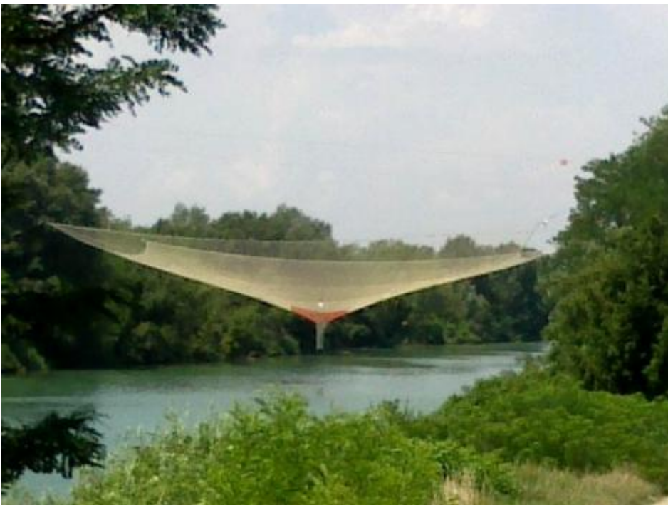
Una rete al centro.