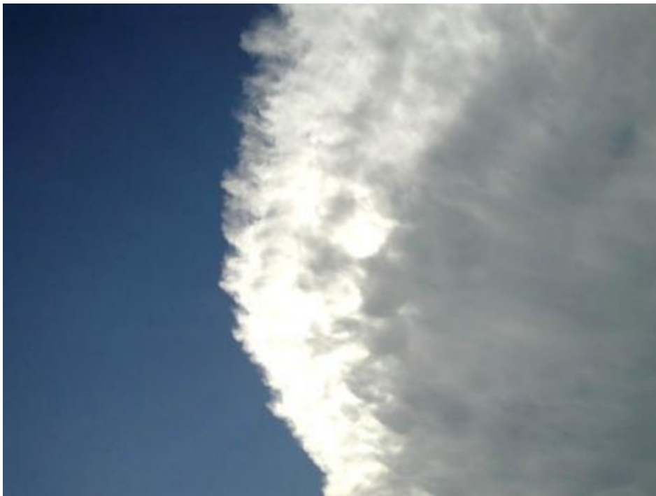
Grande Cirro friulano.